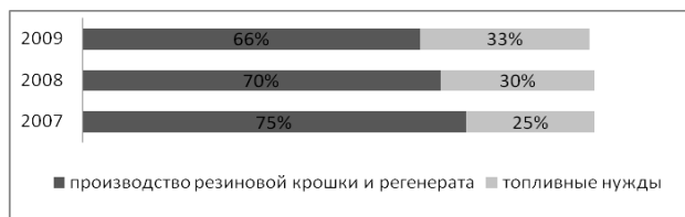
Рис. 2. Структура переработки изношенных автопокрышек в АР Крым

Говоря о сферах переработки изношенных автопокрышек можно выделить два основных направления: производство продукции производственно-технического характера (резиновой крошки и регенерата) и сжигание утильных автопокрышек в качестве топлива (рис. 2.)