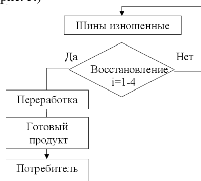
Рис. 4. Новая модель обращения с изношенными шинами в АР Крым

Внедрение инновационной технологии в качестве экономически обоснованного способа переработки утильных шин позволит заменить существующую нерациональную и малоэффективную модель обращения с изношенными шинами в регионе (рис. 5.)