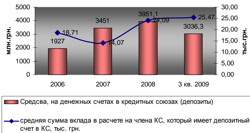
Рис. 4. Динамика привлечения депозитов от членов кредитных союзов.

Уровень капитализации преимущественного большинства кредитных союзов повысился, также существенным образом улучшилось финансовое состояние кредитных союзов, которые имели проблемы с финансовой стабильностью и платежеспособностью.