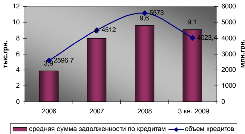
Рис. 3. Динамика кредитования КС своих членов и средняя задолженность заемщика кредитного союза

В 2008-2009 гг. темпы роста привлечения депозитных взносов опережали темпы роста активов, что обуславливалось увеличением резервных фондов для покрытия расходов от невозвращенных кредитов. В целом по Украине на протяжении 2006-2009 гг. общая сумма депозитных взносов увеличилась на 57 %.