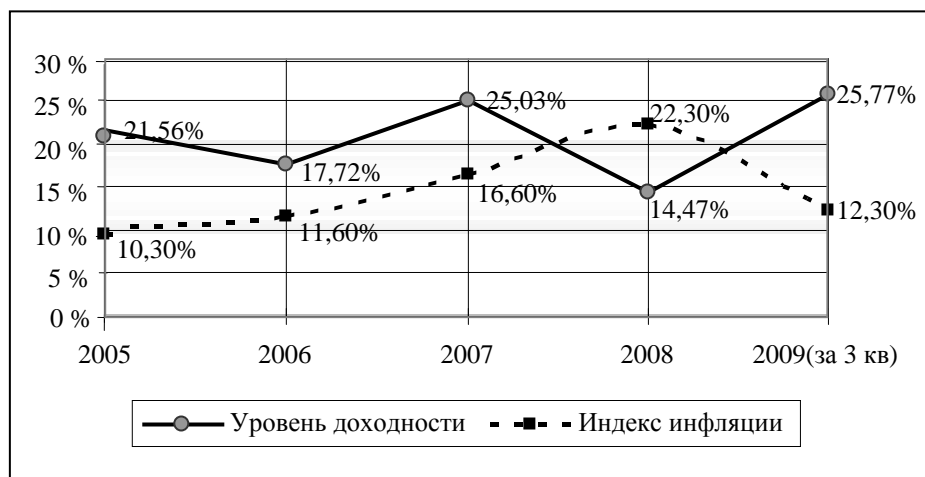
Рис. 5. Уровень доходности НПФ

22,3%. Тем не менее, даже в таких условиях НПФ осуществляли выплаты пенсионерам. В 2009 году НПФ удалось вновь обеспечить доходность ( \approx 26\% ) выше уровня инфляции.