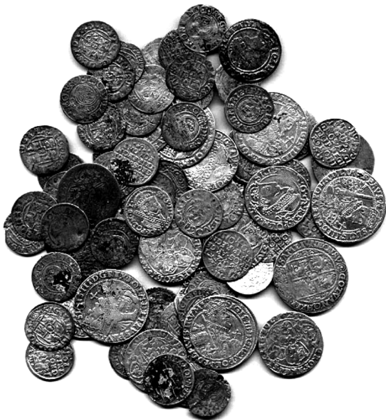
Барський скарб польських, литовських та шведських срібних монет XVII ст., знайдений у 2002 році в м. Барі Вінницької області.