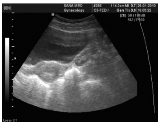
Рис. 1. Однородный эхопозитивный М-эхо эндометрий у здоровой женщины в стадии средней секреции (12,0 мм толщиной)

Во подгруппах 2-б и 2-в на фоне применения НО толщина эндометрия в перивуляторном периоде составляла 9,0 \pm 0,4 мм и 9,25 \pm 0,72 мм (соответственно) и была достоверно больше ( p < 0,05 ) в сравнении со 2-й группой (пациентки до лечения) — 5,5 \pm 0,42 мм и подгруппой 2-а — 6,4 \pm 0,54 мм, а также не имела достоверных