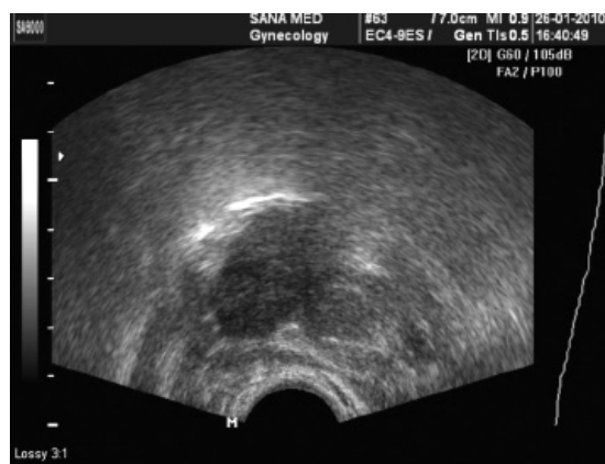
Рис. 2. Отставание прироста толщины эндометрия к середине стадии секреции у женщины подгруппы 2-а после терапии дюфастоном (эндометрий 7 мм толщиной)