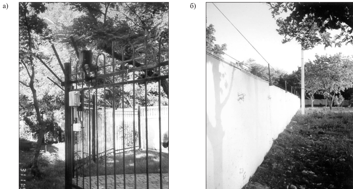
Рис. 4. Проводнорadioволновой извещатель «Рельеф»