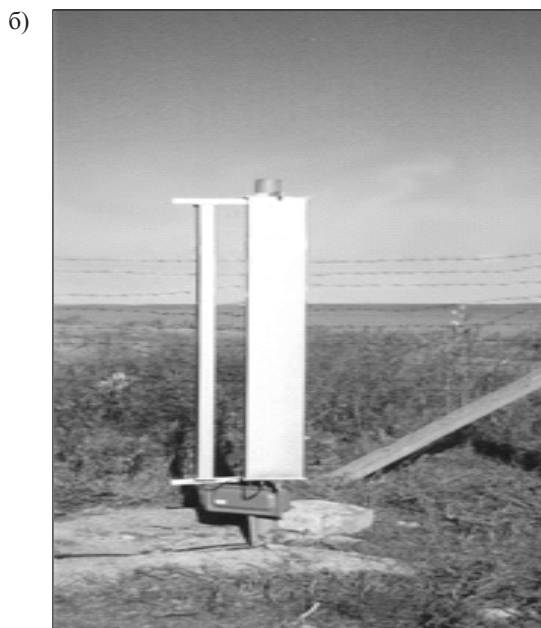
Рис. 3. Радиоволновой извещатель типа ЕМЦ200/2