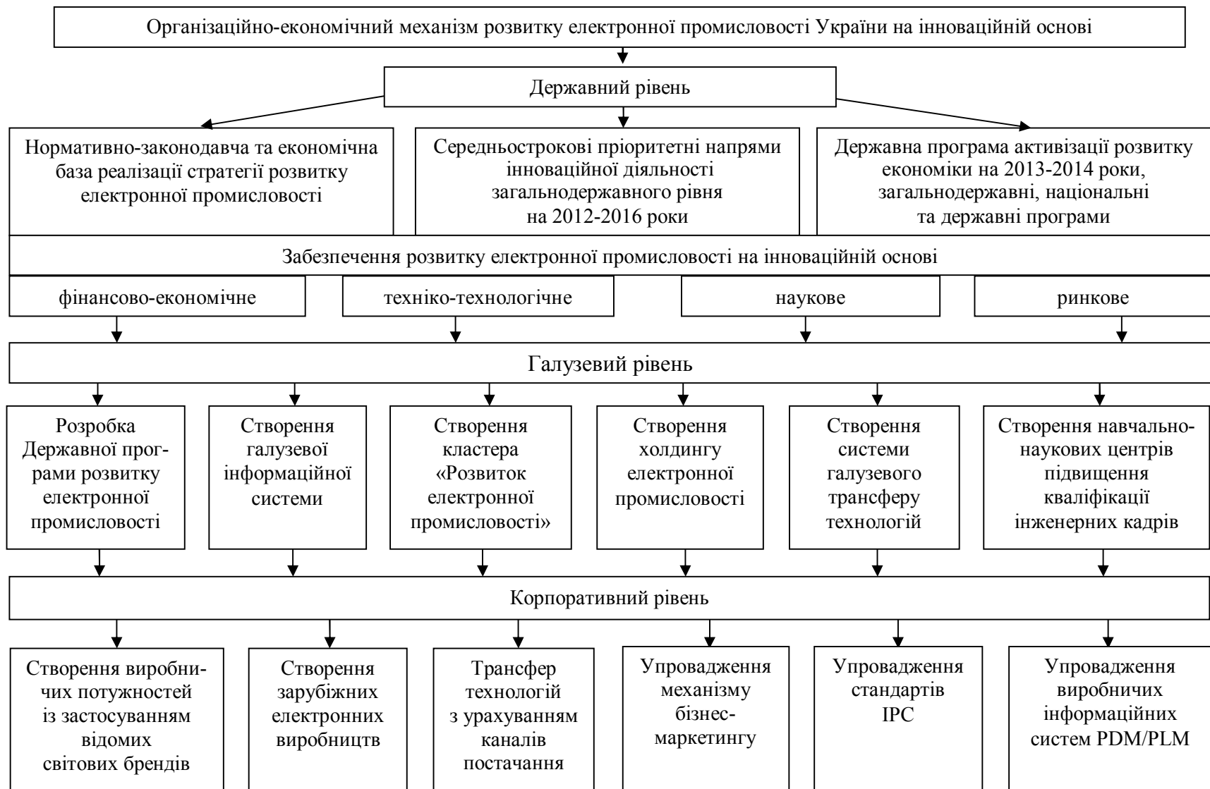
Рис. 1. Структура організаційно-економічного механізму розвитку електронної промисловості України на інноваційній основі