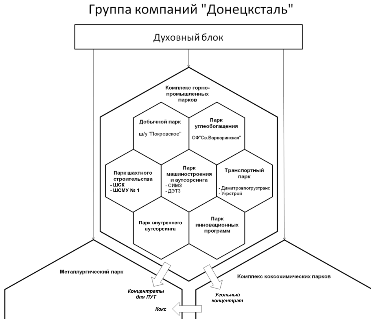
Рис. 1. Структура Покровского горнопромышленного паркового комплекса

Созданный угледобывающий комплекс на базе ш/у "Покровское" уместно рассматривать как горнопромышленный парковый комплекс, в котором имеются модульные парки (парк в парке) и функциональные модули, комплектующие парки (рис. 1).