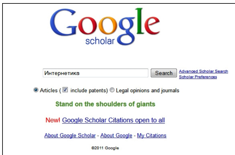
Рис. 3. Google Scholar ( http://scholar.google.com )

Google Академія ранжирує результати за допомогою комбінованого алгоритму, який надає великі переваги кількості цитат і слів, що входять до заголовку документа. Це веде до того, що перші результати пошуку містять найбільш цитовані документи.