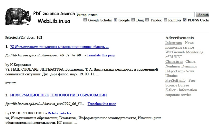
Рис. 4. Інтерфейс метапошукової системи PDFSS

PDFSS сайт nbuv.gov.ua (Національна бібліотека України ім. В.І. Вернадського), ioffe.ru (Фізико-технічний інститут ім. О.Ф. Іоффе), window.edu.ru (Єдине вікно, доступ до освітніх ресурсів) та ін. Більшість із джерел — це сайти університетів, інститутів, а також наукових журналів і електронних бібліотек.