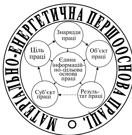
Рис. 2. Загальна послідовність опосередкування в функціональній структурі трудових процесів

На рис.2 добре видно відокремленість інформаційно-цільової основи праці від її генетичної матеріально-енергетичної першооснови, на якій базуються інші підсистеми соціальної сфери, включаючи ідеально-інформаційну мету в голові живого суб'єкту. Тут слід звернути особливу увагу на специфічний ефект внутрішньої "самоізоляції" соціуму від своєї першооснови феноменом інформації, оперативного-технологічного та історично-матеріально зафіксованої на інертних щодо її сутності та змісту носіях.