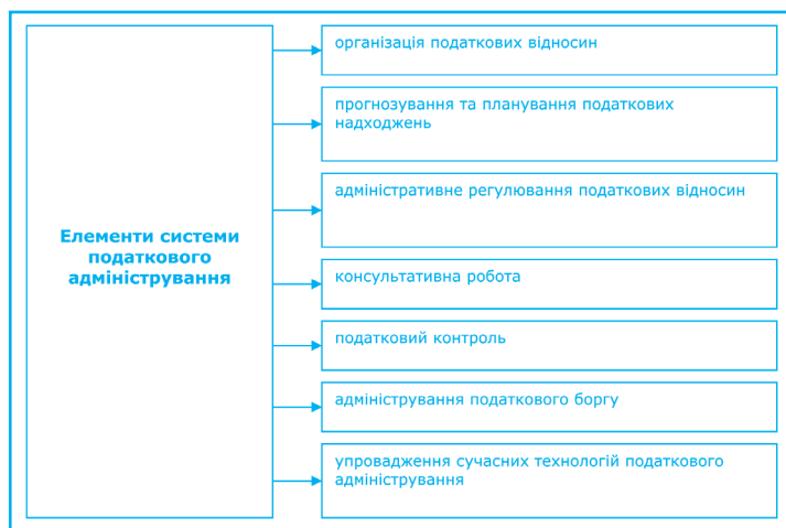
Рис. Елементи системи податкового адміністрування

Особливістю податкового адміністрування як економіко-правової категорії є відсутність його визначення в законодавчих актах. У Податковому кодексі України в