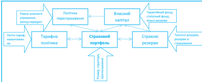
Рис. 2. Взаємозв'язок основних проблемних сфер страхової діяльності

Проаналізувавши бізнес-процеси, фінансові та інформаційні потоки, особливості функціонування й управління СК [4; 5; 6; 7], були виявлені основні важелі (параметри) впливу на фінансову стабільність страховика і проблемні сфери, у межах яких здійснюється цей вплив. Важливим тут є не просто їх визначення, а розуміння системи взаємозв'язків між ними. В узагальненому вигляді зв'язок між проблемними сферами управління СК наведено на рис. 2 (прямокутник відповідає проблемній сфері, а стрілка – параметру впливу на фінансовий стан СК).