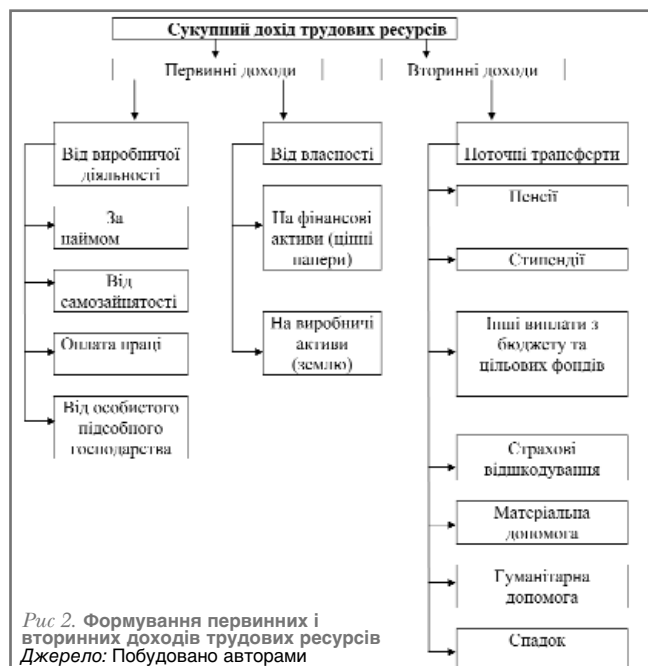
Рис 2. Формування первинних і вторинних доходів трудових ресурсів

Як зазначалося вище, функціонування робочої сили в умовах ринкової економіки неможливе без використання коштів, рух яких здійснюється у формі грошових потоків.