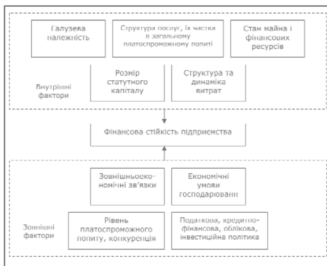
Рис. 2. Фактори впливу на фінансову стійкість підприємства

Залежно від впливу означених вище факторів можна виділити такі види фінансової стійкості підприємства: поточна (на момент проведення аналізу) і потенційна (перспектива нарощувати обсяги діяльності протягом певного часу та вихід на новий рівень фінансової рівноваги). Отже, ФС підприємства у короткостроковому періоді означає досягнення стану рівноваги, у довгостроковому періоді – трансформування