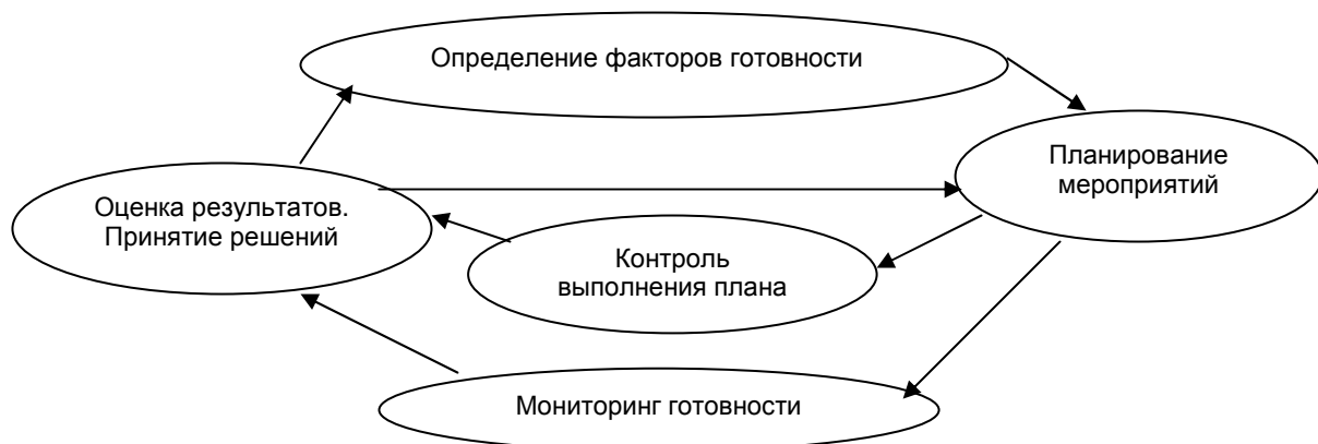
Рис. 1. Контур управления подготовкой сил и средств по ликвидации последствий ЧС

Основные задачи управления АСФ можно представить в виде схемы контура управления, изображенной на рис. 1.