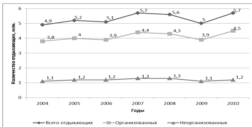
Рис. 3. Динамика количества прибывших отдыхающих в АРК в 2004-2010 гг. (млн. чел.) [2].

количество организованных, т.е. тех туристов, которые приобретают туры по заранее согласованным маршрутам, срокам пребывания, объёму предоставляемых услуг через специальный туристский сбытовой аппарат. Характеристика спроса отражена в таблице 1.