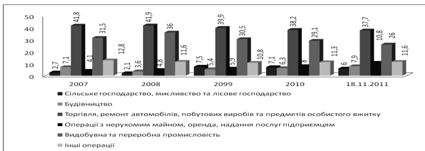
Рис. 1. Структура кредитів, наданих банківськими установами суб'єктам господарювання за видами економічної діяльності 2007-2011 рр.,%

З 3844 підприємств сільського господарства Вінницької області, які зареєстровані в Єдиному державному реєстрі підприємств та організацій України станом на 01.01.2012 р., залучили кредит 107 підприємств, а кількість що залучили пільгові кредити становить 17 підприємств (рис. 2) [4]. Обсяги залучених кредитів у 2011 році підприємствами АПК Вінницької області порівняно з 2010 р. збільшилися на 294 % та становлять 581,6 млн. грн., з них короткострокових кредитів – 427,5 млн. грн., середньострокових 76,1 млн. грн., довгострокових 78,0 млн. грн. Заборгованість за кредитами АПК станом на 01.07.2011 року склала 654,9 млн. грн., в тому числі прострочена заборгованість – 30,4 млн. грн., пролонгована – 114,7 млн. грн. [5].