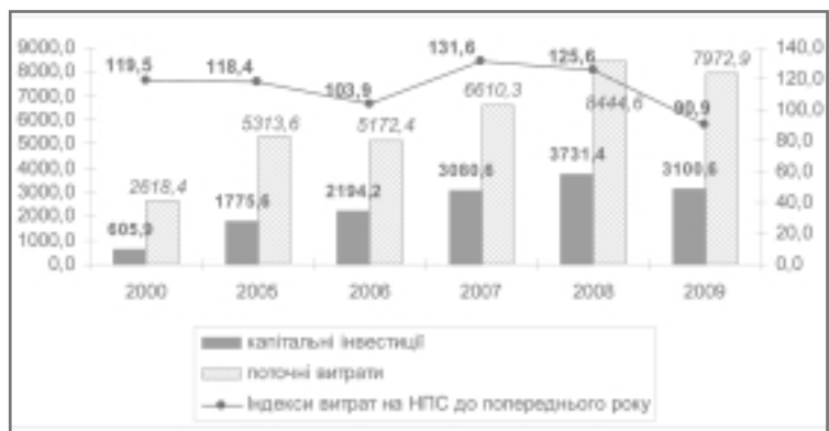
Рис. 2. Динаміка загальних витрат підприємств, установ і організацій України на фінансування заходів з охорони й раціонального використання природних ресурсів за 2000–2009 рр., млн. грн.