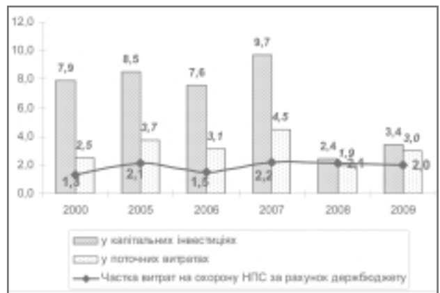
Рис. 3. Динаміка частки витрат на охорону НПС за рахунок коштів Держбюджету у 2000–2009 рр., %