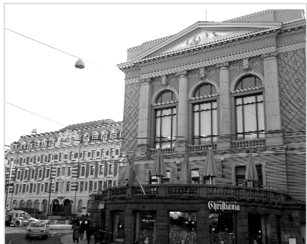
Осло – столиця Королівства Норвегія