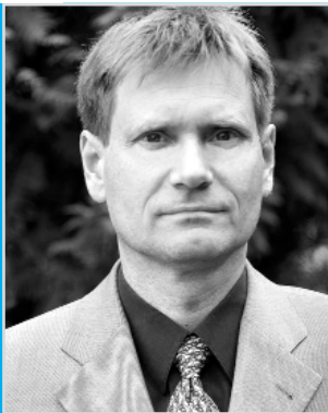
Олав Берстад, Посол Королівства Норвегія в Україні