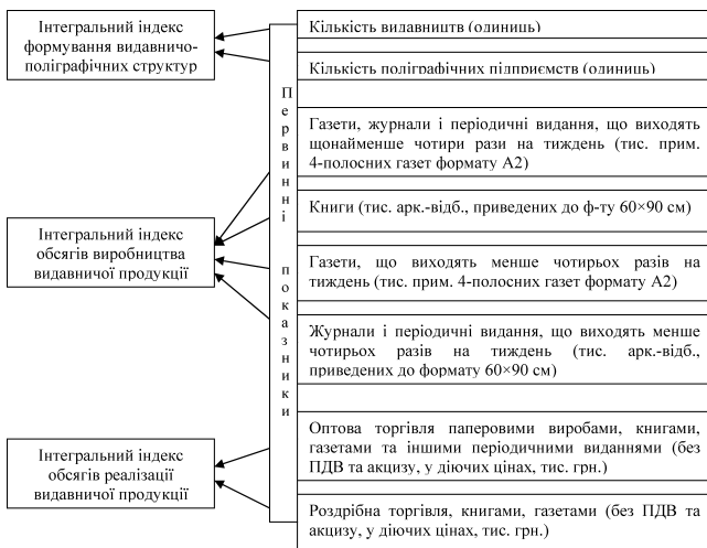
Рис. 2. Принципова схема розрахунку інтегральних індексів

ральных індексів, що отримані за конкретний період (у нашому випадку за 2004–2005 рр. та 2005–2006 рр.).