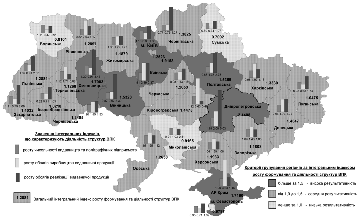
Рис. 3. Темпи росту результатів формування та діяльності структур ВПК в регіонах України (2004-2006 рр.)

Очевидно, що для більш достовірної оцінки варто брати до уваги не лише запропоновані, але й інші показники як у натуральному, так і у вартісному вимірі, дані дослідження будуть проводитися в перспективі. Однак, на нашу думку, запропоновані нами методичні підходи та сукупність сформованих критеріїв дозволяють проводити оцінку та порівняння діяльності ВПК в регіонах України різного рівня (область, район) та виявляти ступінь впливу окремих регіональних факторів на його розвиток.