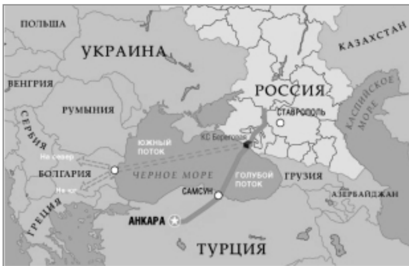
Рис. 1. Схематичний (пропагандистський) вигляд проекту «Південний потік» [5]

Кожний новий масштабний проект повинен прив'язуватися до нових газових покладів. Але в даному випадку цього не простежується. «Південний потік» передбачає забезпечення