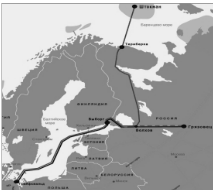
Рис. 3. Схема проекту «Північний потік» [6]

Сумарна потужність обох «потоків» (118 млрд. куб. м), якщо гіпотетично уявити, що вони будуть реалізовані, – майже така сама, як і газотранспортна система Ук-