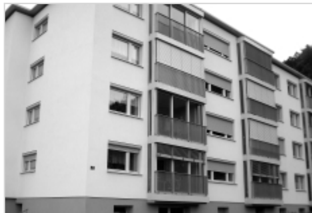
Соціальне житло з сонячними батареями в місті Ранквайль

Як комунальне підприємство «Вогевосі» зобов'язане будувати житло там, де визначила громада, бо інакше втратить свою ліцензію. Капітал фірми прив'язаний до її цілей. Вона керується принципом покриття видатків: оренда житла не повинна бути меншою собівартості, але не може й суттєво перевищувати її. Порівняно з приватними забудовниками, які планують здати житло в оренду, у компанії типу «Вогевосі» є лише одна перевага: вони звільнені від податку на прибуток корпорації (а він складає 25%). Норми прибутку компанії: до 3,25% у