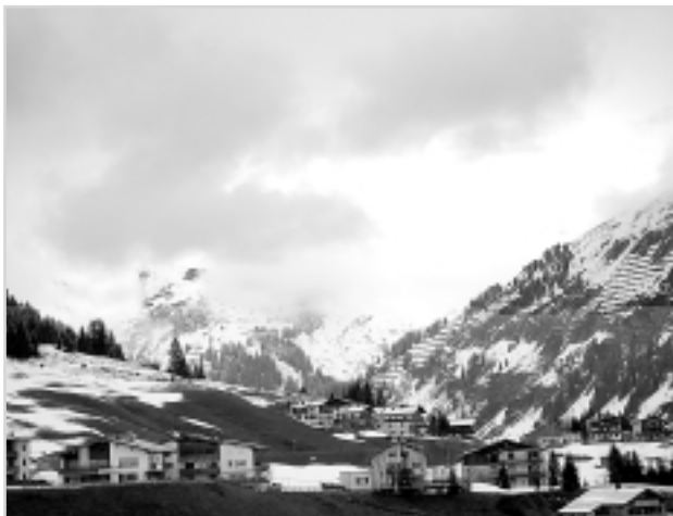
Місто Лех у серці Альп