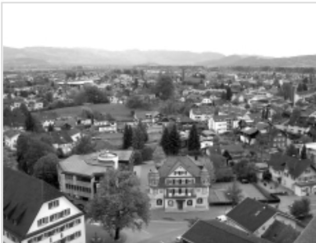
Панорама міста Ранквайль