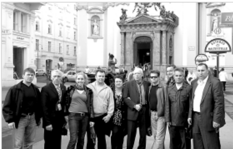
Українська делегація у Відні

керівник відділу маркетингу Інституту трансформації суспільства