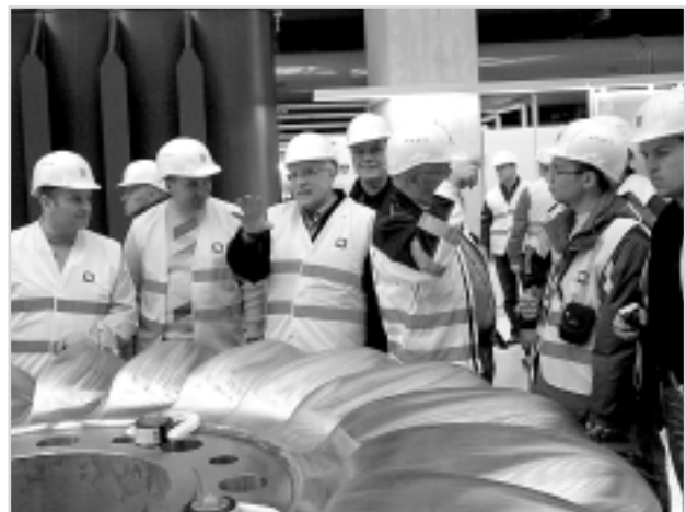
Міські голови відвідали гідроелектростанцію Копсверке-2 у передмісті Фельдкірха

Варто зауважити, що практично в усіх регіонах Австрії лінії електричного сполучення перебувають у комунальній власності федеральних земель. Виняток становить лише Земля Карінтія, де 25% цих мереж володіє Французький енергетичний концерн. Ціна на електроенергію для населення може варіюватися в різних зем-