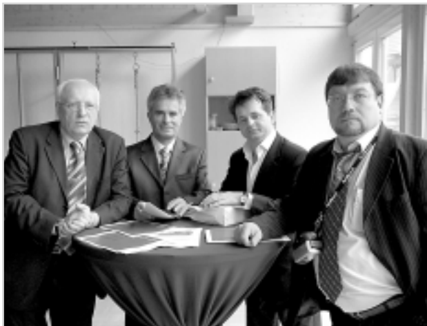
У муніципальному дитсадку Дорнбірні

Цікавою особливістю системи шкільної освіти є відсутність державних спортивних, музичних, художніх шкіл. Їх функцію в муніципалітетах виконують місцеві об'єднання громадян – так звані музичні, спортивні, творчі союзи, які мають високий рівень дотацій із міського й обласного бюджетів на забезпечення матеріально-технічної бази, проте фахівці зазвичай навчають там дітей на громадських засадах. Іншими джерелами