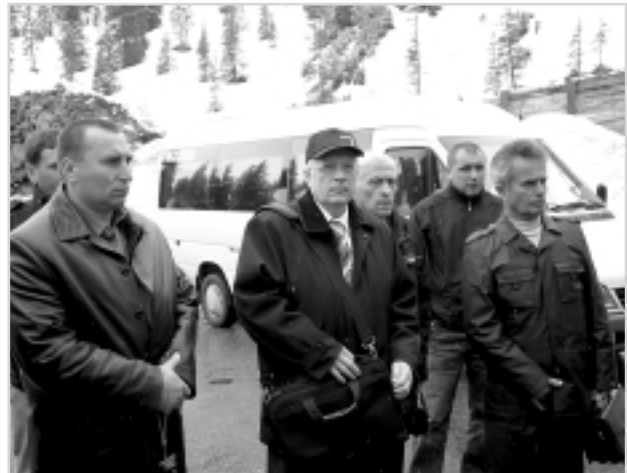
Члени української делегації у місті Лех

З 1999 р. в місті працює підприємство «Біомаса – близьке теплопостачання». Під час його створення світові ціни на нафту були значно нижчими за сьогоднішні й становили $12 за барель. А ціна на газ, як відомо, безпосередньо залежить від ціни на нафту. Та-