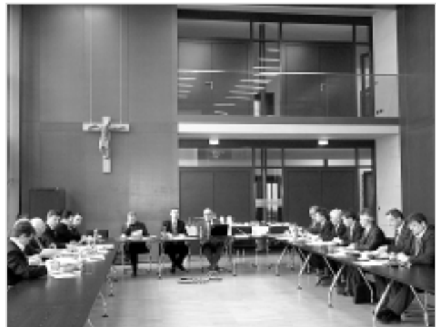
Під час зустрічі з керівниками міської влади Дорнбірна