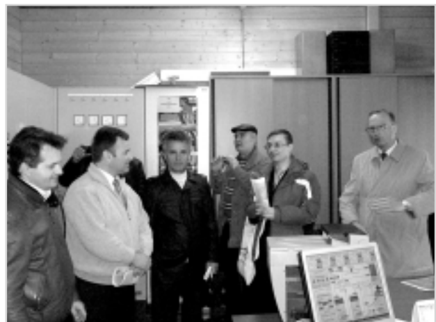
На пункті керування заводу з переробки біомаси в муніципалітеті Лех

Заводи на біомасі в Леху не виробляють електричну енергію, а лише теплову. Однак відомо, що в разі потреби тепла енергія може бути легко трансформована в електричну, що потребуватиме незначних витрат. Зазначимо, що опалювання на біомасі починає запроваджувати й ряд українських міст. Зокрема, чотири котельні на біоматеріалі вже працюють у місті Ковелі, дві – у місті Дубно.