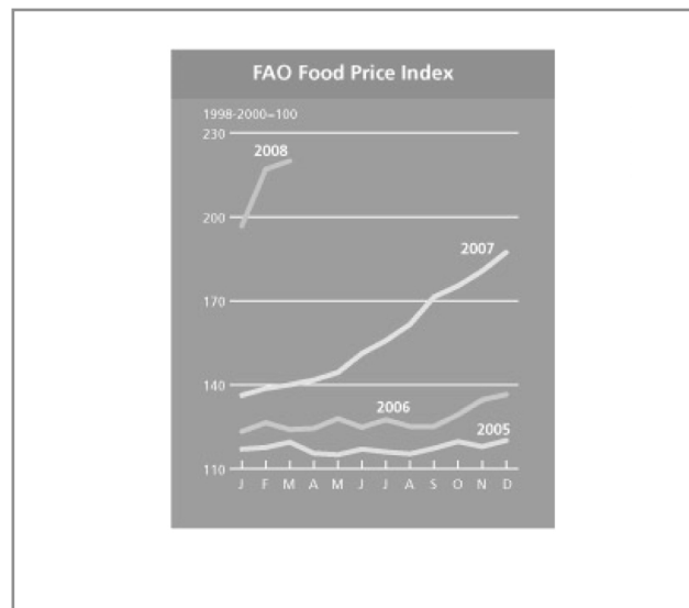
Рис. 2. Індекс продовольчих цін

через порушення пропорції між попитом і пропозицією (див. Індекси цін продовольчих товарів та Індекс продовольчих цін. – рис. 1, рис. 2).