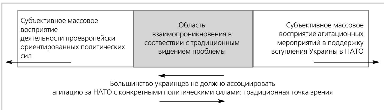
Рис. 1. Традиционное представление того, как населением Украины воспринимается место агитационных мероприятий в поддержку вступления Украины в НАТО и их взаимосвязь со сферой политического [Противоположно направленные стрелки внизу рисунка обозначают желание сторонников НАТО «развести» эти две различные сферы социальной активности – политической и личной.]

По сути, обе описанные методологические сложности в проведении в Украине агитации за НАТО во многом созвучны между собою. Первая из них указывает на необходимость качественных, а не количественных изменений стиля агитации в южных и восточных регионах страны, трансформации базовых исходных предпосылок; вторая – мотивирует направление, по которому следует менять эти базовые исходные предпосылки.