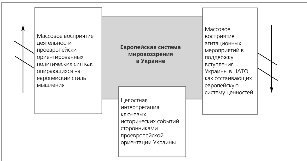
Рис. 1. Невозможность деполитизировать проблему НАТО в связи с тем, что деятельность и проєвропейских политических сил, и сторонников НАТО в Украине «привязывается» в глазах населения к единой общей системе мировоззрения

Думаю, что необходимо уважительно склонить голову перед усилиями сторонников преодоления бинарности Украины и их стремлением внедрить на территории от Луганска до Измаила европейскую систему ценностей, в противовес преимущественно существующей там евразийской системы ценностей. Однако при этом аргументацию за вступление в НАТО не следует делать заложником успеха или неуспеха национально сознательных идеологов Украины.