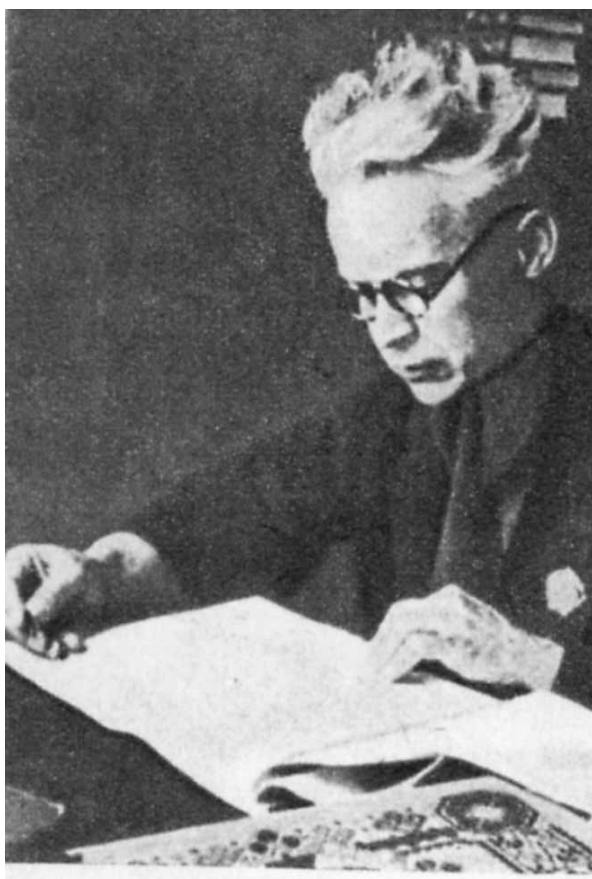
О. Довженко. Кінець 1930-х років

кінематографії), архіви якого після реорганізації художнього факультету КДІКу потрапили до ВДІКу;