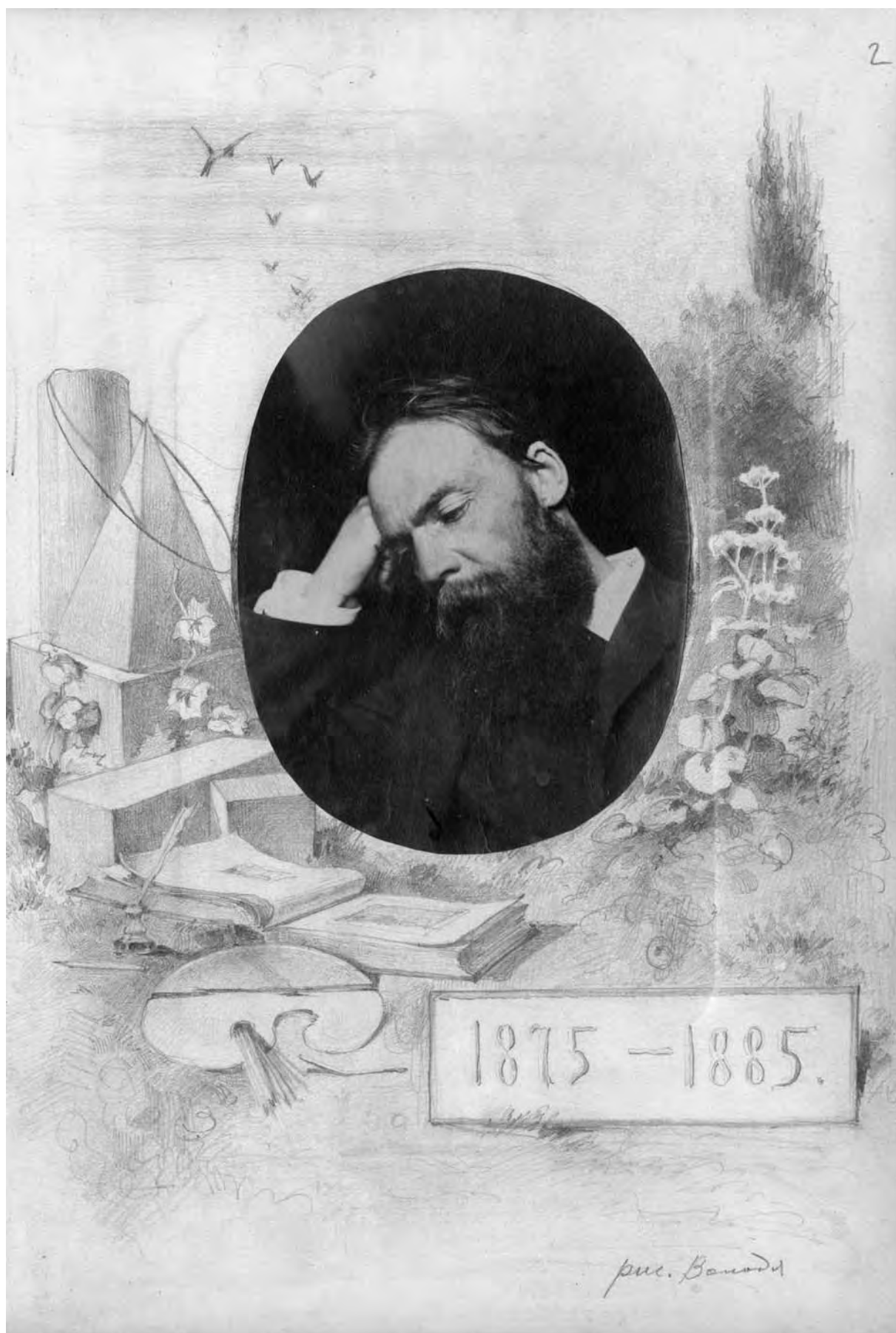
В. Андреев. 1875–1885 [до 10-ліття Київської рисувальної школи. М. Мурашко]. 1885 р. Світлина, олівець. (публікується вперше)