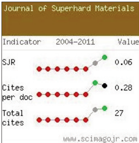
Рис. 3. Графік зміни показника SJR журналу "Сверхтвердые материалы"

читачів привернули статті, в яких повідомлялося про синтез нових надтвердих фаз, моделювання структур та особливості структурних перетворень за високих значень тиску і температури. Особливо цікавими для наукової спільноти виявились статті, в назві яких були слова "пошук", "новий", "надтверда фаза" і т. п. Це вказує на світову тенденцію пошуку нових перспективних надтвердих матеріалів та шляхів досягнення цього. Аналіз також показав, що, у першу чергу, увагу привертають статті, підготовлені авторським колективом з кількох організацій. Очевидно, тільки в тісній співпраці, кооперації зусиль і ресурсів можна досягти вагомих наукових і практичних результатів.