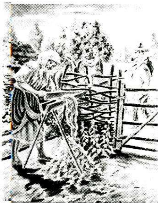
«Жінка тіпає прядиво на бательниці»

Іван Дмитрович Коваль (1946–2000) — самобутній художник, народився в селі Кирнасівка. Він з дитинства був прикутий до ліжка тяжкою недугою. Але мав талант, силу волі, мужність, працьовитість та маму,