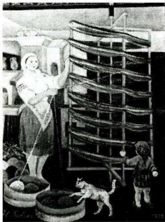
«Ткаля снує основу»

«Застеляли подвір'я ряднами, складали одне до одного конопляні матіркі і молотили ціпами. А конопляне насіння віяли, частину залишали його для майбутньої посіви, а остальна частина йшла в їстівний продукт. Наприклад, я вижив на конопляному насінні».