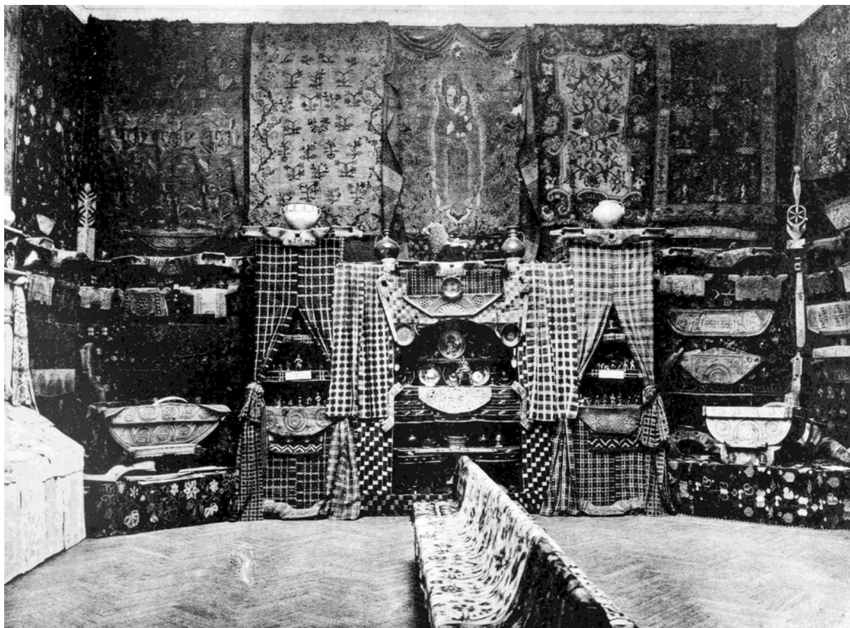
Експозиція Першої південноросійської кустарної виставки. 1906 р.

ти на стінах речі, то нам не тільки стало мало двох зал, але був зайнятий весь верхній поверх музею, де було аж п'ять зал, вестибюль та переходи зі сходами. Розвісивши на стінах, ми самі побачили у всій силі красу нашого мистецтва. Ми (троє) перестали вже боятися за успіх виставки, а відвідування публіки перевершило навіть найбільш оптимістичні припущення в декілька разів 14 . Активну участь братів Щербаківських у підготовці виставки засвідчила й О. Косач, яка назвала їх першими серед “ревних помічників” директора КХПНМ 15 .