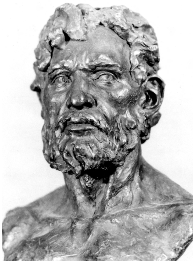
Рис. 2. Чоловік із неолітичного могильника біля села Вільнянка Запорізької обл. (реконструкція Г. В. Лебединської)

Розглядаючи питання про найдавніші морфологічні витоки слов'янства, Т. І. Алексеева чомусь не залучила даних з антропології неолітичних племен гребінцево-накольчастої кераміки Подніпров'я, які залишили пам'ятки культур дніпро-донецької спільності. Згідно з радіокарбонними визначеннями, вони датуються серединою VII — серединою III тис. до н. е. 11