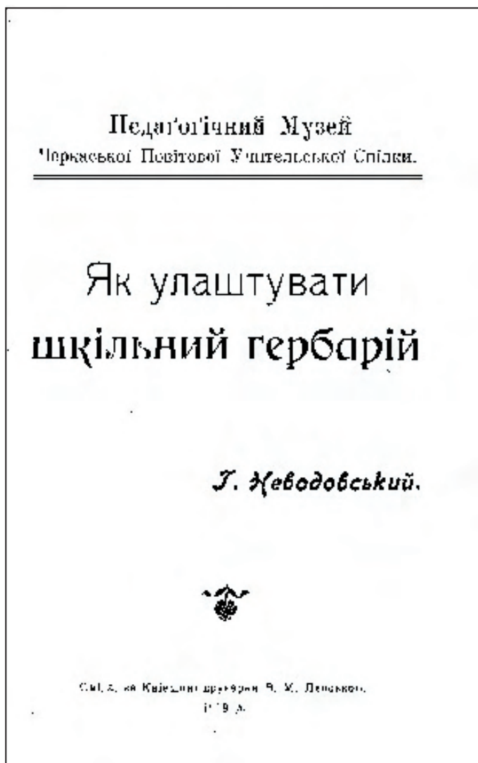
Титульний лист брошури