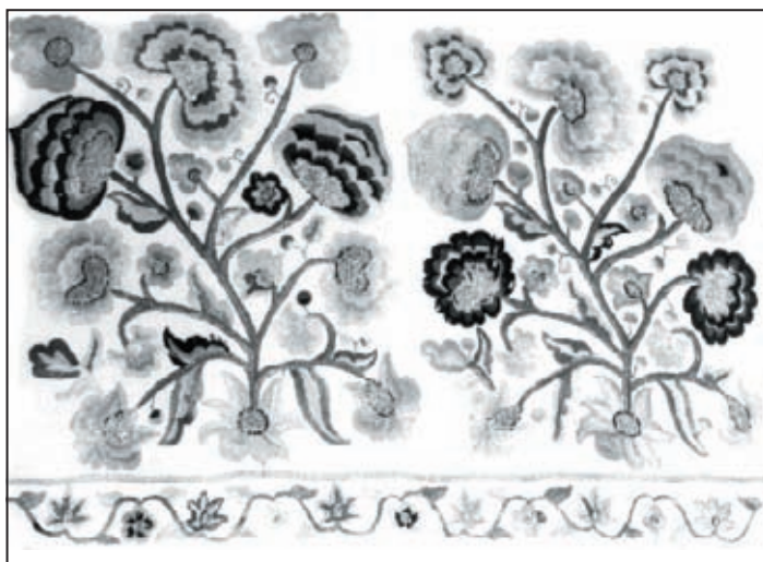
Окрайка сер. XVIII ст. Инв. № И-947

у середовищі козацької старшини. В пишних багатоколірних композиціях цих вишивок знайшли відображення декоративна барвистість та примхливість форм бароко. Але, на відміну від західноєвропейських вишивок з їх натуралістичною світлотіньовою манерою виконання, орнаменти українських вишивок з притаманними їм стилізацією, площинністю, фольклорною узагальненістю несуть на собі ознаки впливу народних художніх традицій. Подібні композиції зустрічаються на фрагментах вишитих окрайок, яких чимало в колекції ЧІМ, чи на оздобленому вишивкою подолі спідниці (И-448) 1 . Характер орнаменту на чохлах