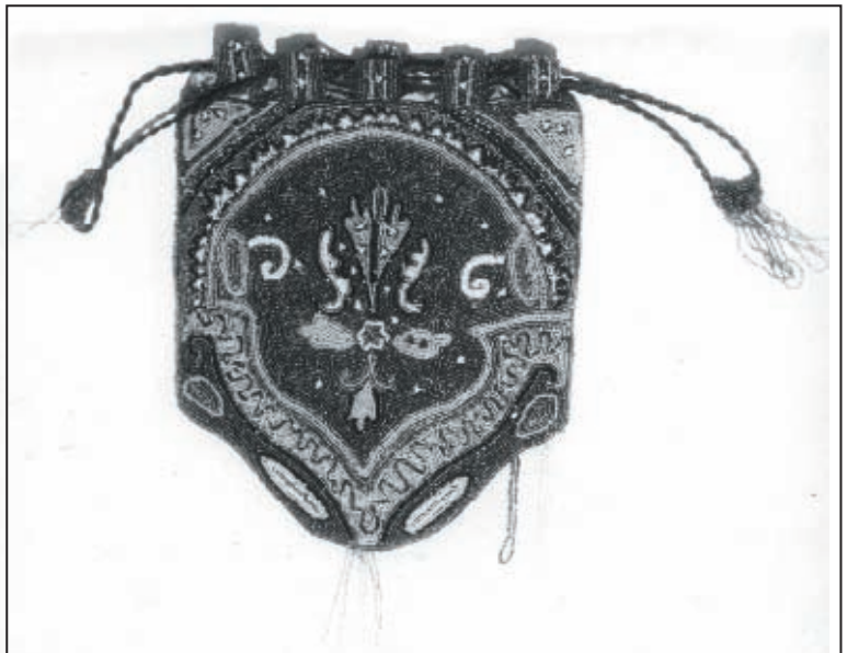
Сумочка. Инв. № И-7028

квітки-роzetки, від якої відходять соковиті пелюстки. Плавні, суворі контури пелюсток та квіток створюють враження спокою та рівноваги. Ці мотиви збігаються з формами рослинного орнаменту кінця XVII ст., який зберігся на гаптованих денцях кибалок та опліччях фелонів. 5 Техніка у прикріп, якою виконано вишивку на сумочці, та оконтурювання елементів орнаменту контрастним за кольором бісером також знаходять найближчі аналогії у гаптованих речах XVII–XVIII ст.