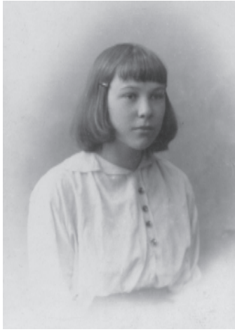
Ладя (Лідія) Могілянська. Фото 1917 р.

- Глупости Вы говорите, а что хуже – глупости делаете! - Знаешь, в конце концов от всегда умного поведения устаешь и можно же себе позволить, наконец, малейшее удовольствие сделать глупость.