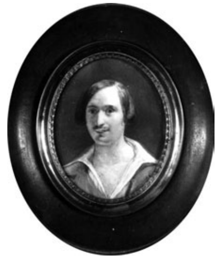
М. В. Гоголь

Про інші візити М.В.Гоголя до Качанівки або Потоків знаємо з листів Василя Васильовича та його дружини Л.В.Тарновської. З теплотою згадує Людмила Володимирівна про приїзд Миколи Гоголя в листі від 26 жовтня 1850 року до сина Василя, який навчався в той час у Москві: «Сегодня мы ожидаем на обед Архиеерея, который объезжает свою епархию и обещал быть у нас. Также ожидаем Гоголя, он был уже у нас два раза, а теперь будет опять, ехавши в Одессу. Он друг папин, они вместе воспитывались. Ты верно знаешь, что Гоголь – известный писатель. Помнишь ли ты его сочинение Тараса Бульбу и Ссору Ивана Ивановича с Иваном Никифоровичем (подчерслено Л.Т.). Помнишь, как ты смеялся, когда папа читал Ивана Иван[овича]. Он и теперь читал нам свое сочинение, которым мы восхищались». 8 Лист Василя Тарновського до Миколи Гоголя від 10 листопада 1851 року є яскравим свідченням їхньої дружби: «С нетерпением ожидаем я и жена моя твоего приезда, милый друг Николай Васильевич, и надеемся, что ты заедешь к нам не на часок, а по крайней мере на денёк, если не более. Подорожная для тебя давно взята и ожидает тебя в Потоке. Мы с женой начинаем уже мечтать, что ты раздумал ехать в Одессу, проживешь зиму в здешних местах и мы будем иметь много наслаждений. Теперь, кажется, наши предположения разрушились; по крайней мере утешаюсь мыслью, что наша дружба юности, возобновившись в зрелые лета, окрепнет и мы будем жить, как братья. Весь твой В.Тарновский». 9 На жаль, ця подорож М.В.Гоголя не відбулася, бо виї-