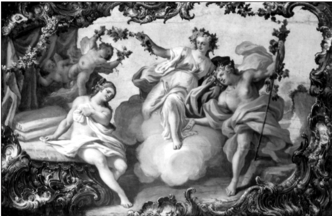
Панно з музею мистецтв Богдана та Варвари Ханенків. Французький художник XVIII ст. Аріадна і Вакх. Франція. Після реставрації 1997 р.

Твори мисткині є в Дирекції художніх виставок у Києві, приватних збірках України, Великої Британії, США, Німеччини, Ізраїлю. З її роботами можна ознайомитись у