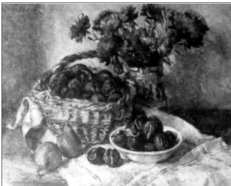
Валентина Подкопаєва. Натюрморт. 1990 р.