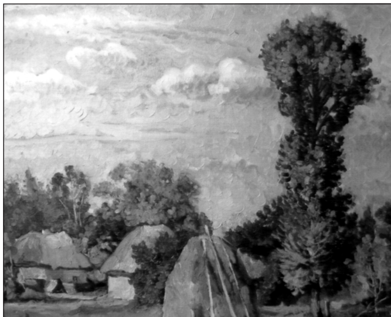
Валентина Подкопаева. Сорочинці. Подвір'я. 1990 р.