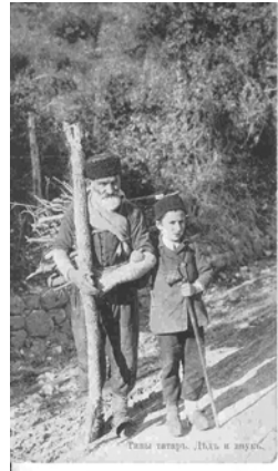
Татарские женщины. Ялта и Крым.