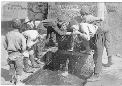
У фонтана. Приселок в Крыму.