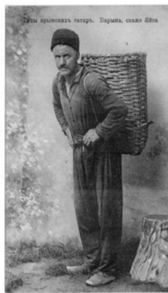
Татарские женщины. Парма, село Ялта.