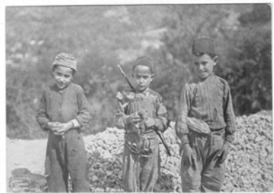
Крым — Крым.