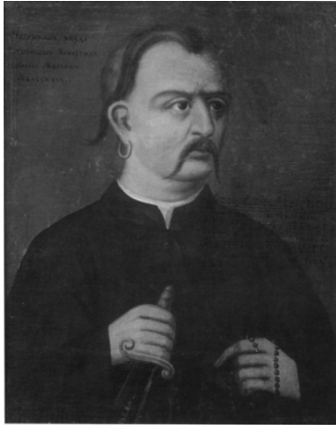
Портрет Максима Залізняка. Невідомий художник. II половина XVIII ст. Напис у верхній частині ліворуч: “МАКСИМЪ ЗАЛІЗНЯКЪ КОСАКЪ ПОЛТАВСКОГО МОНАСТІРІЯ”. Праворуч зображено ноти з саваши: “ТА НЕ БІГДЕ ЛУЧШЕ ТА НЕ БІГДЕ КРАШЕ: АЖЪ ЧІ НАСЪ ТА НЕ ЧОРА: ІЗЪ СІД НЕ МАЄ ЖИВА: ШО НЕ МАЄ ЛЮБА: ТА НЕ БІГДЕ ИЗМІНА”. Полотно; олія. 67,5 x 91,5 см. СДХМ, П.ОЖ.16.

“Кто же обратил в Железняк сего мирнаго”селянина”, может быть и теперь еще сеющего гречь на полтавских жажитях?” [1, 222].