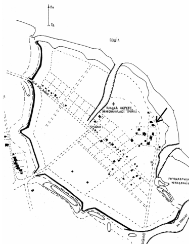
Рис. 1. Забудова території Фортеці та посаду (реконструкція)

Декор кахлі типу 166 (Рис. 2: 4), викликає особливий інтерес. Орнаментальну композицію квадратної лицьової кахлі (21 x 21 см) можна умовно поділити на три яруси. Нижній ярус являв собою три квадрати, що були складені з рядів маленьких квадратиків. Середній ярус складається з фігур, утворених дугоподібними лініями, і розділених одна від одної у верхній частині