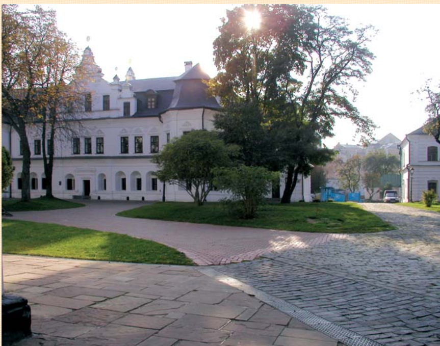
Вид на Митрополичий будинок від північно-західного рогу Софійського собору. Архівне фото, 1985 рік.

На момент розробки положень Концепції стан насаджень на історичній монастирській території можна було охарактеризувати наступним чином: