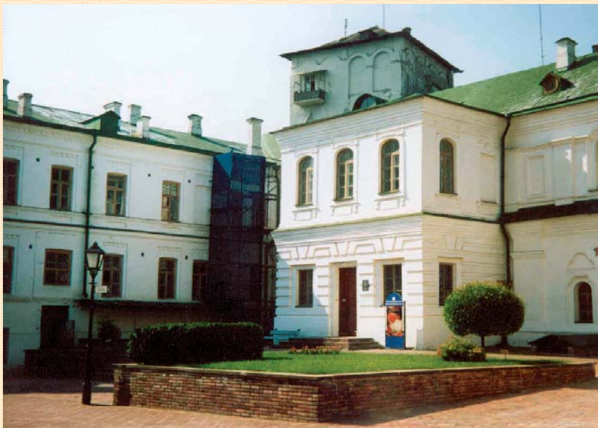
Будинок Хлібні та Консисторія, Сучасний вигляд.