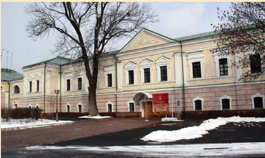
Сучасний вигляд будівлі. 2011 р.

садибі дерев'яну оранжерею. Можна припустити, що до запровадження у 1781 р. Київського намісництва це приміщення могло одночасно або частково, наприклад, ліве крило, використовуватись і під губернаторську канцелярію.