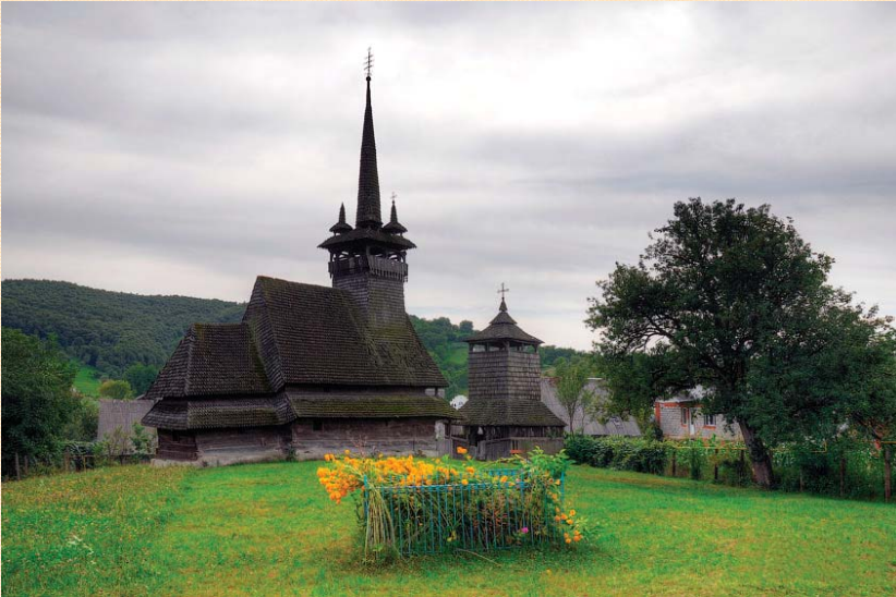
Церква Св. Параскеви в с. Олександрівка (XV ст., 1753 р.).