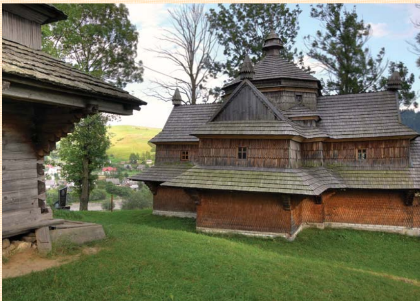
Церква Вознесіння Господнього в селищі Ясіня (1824 р.).