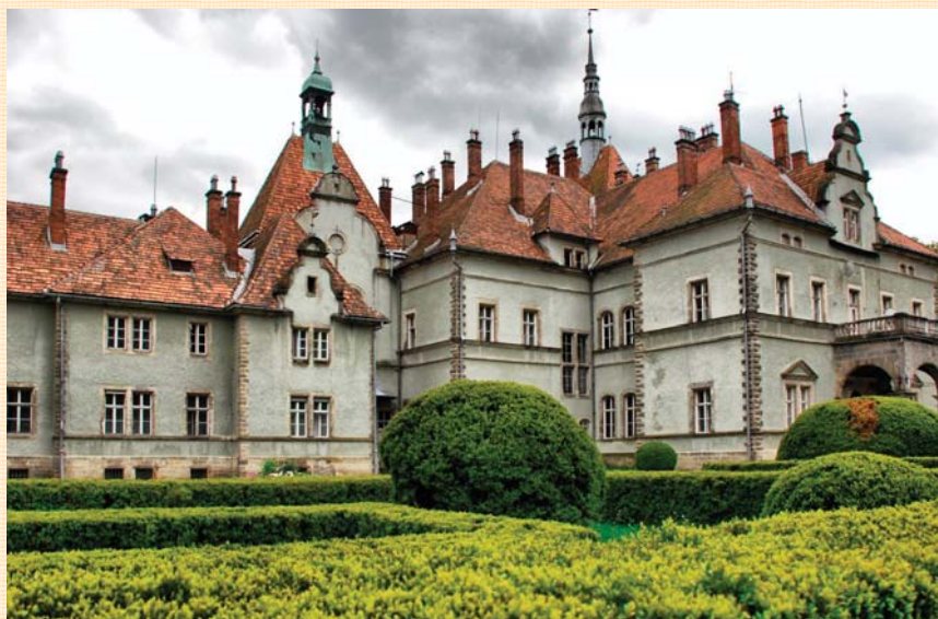
Смт. Чинадйово. Мукачівський р-н, Закарпатська обл. Мисливський замок Шенборнів. 1890-1895 (нині – санаторій "Карпати").