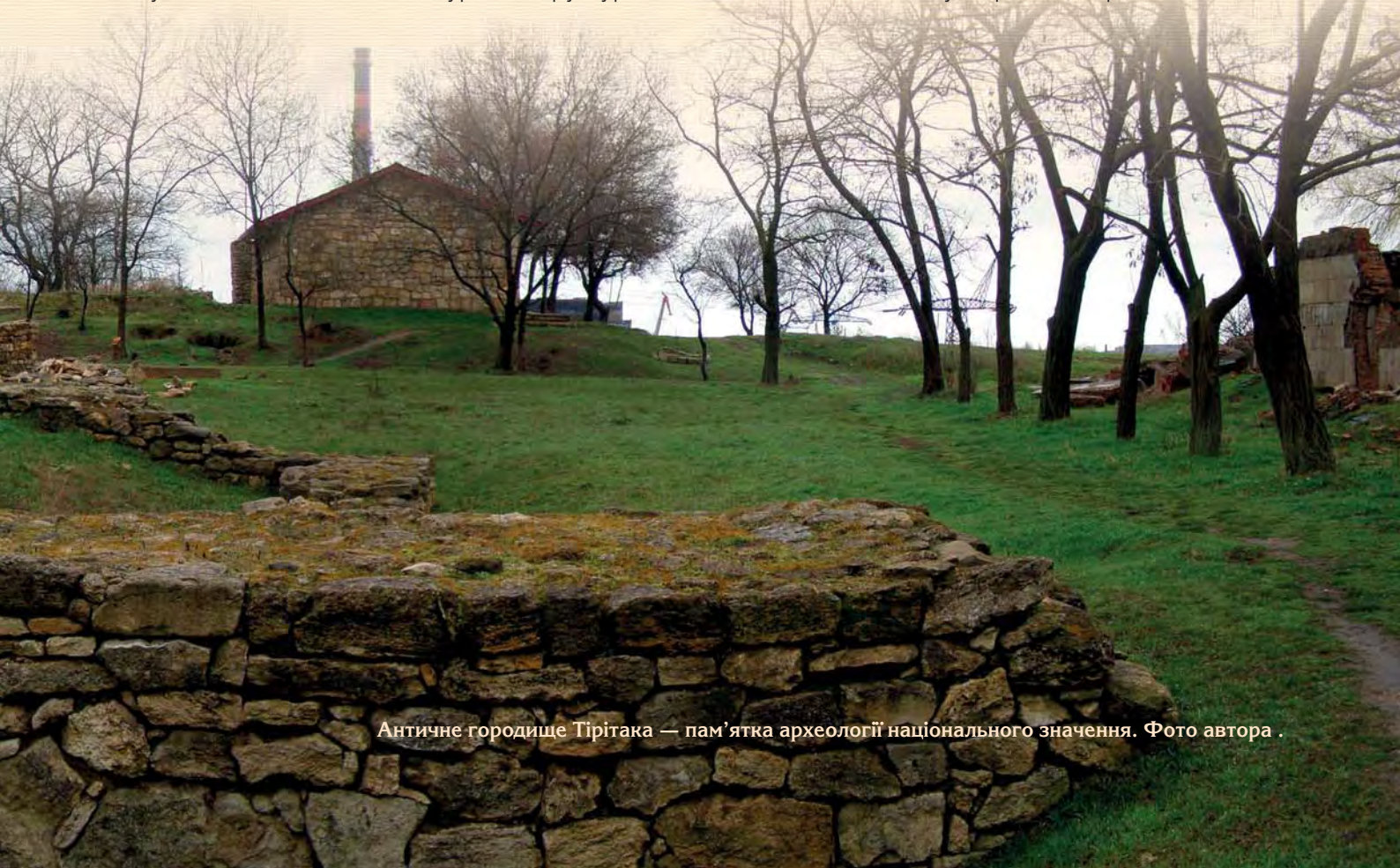
Античне городище Тірітака — пам'ятка археології національного значення.