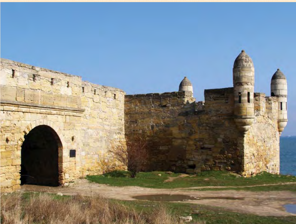
Фортеця Єні-Кале. “Водяний” бастион з південною, Керченською брамою.

Єнікальський маяк — найстаріший маяк, який зберігся в Керчі, 1821 р., реконструйований у 1954 р. Щойно виявлений об'єкт культурної спадщини.