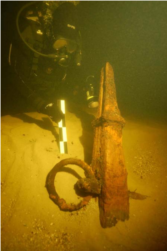
Фото 1. Подводный осмотр и замер якоря на дне.

Так, например, у Наумовой балки был поднят двурогий якорь с деревянным штоком адмиралтейского типа (фото 1-2).