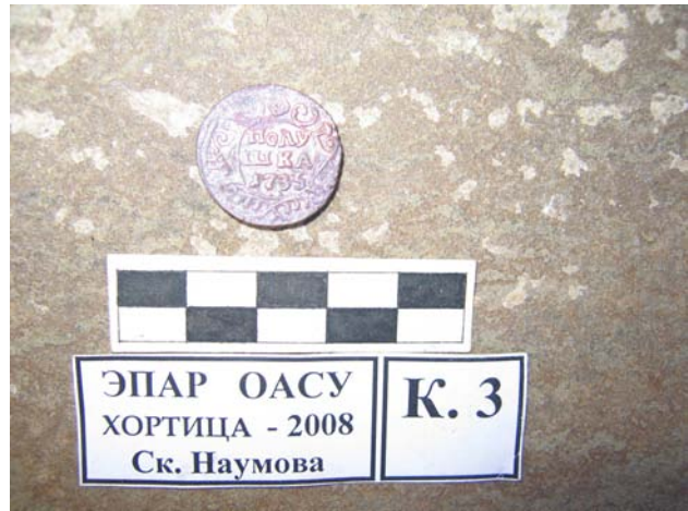
Фото 11. Монета полушка чеканки 1735 года.

На побережье балки «У Перевоза» найдены пустотелая паяная солдатская пуговица и монета «полушка» чеканки 1735 года (фото11).