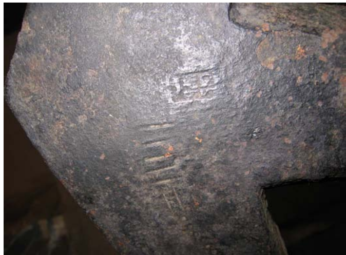
Фото 3. Клеймо и маркировка на тренде якоря. 1736-39 гг.

Этот якорь был обнаружен в 1990 году на глубине 10,5 м. Тогда из песчаного склона дна выступало около трети соснового штока с квадратным кованым бугелем. Высота веретена якоря 169,5 см., ширина лап 104 см. Длина деревянного штока 177 см. Диаметр рыма 25 см. На тренде якоря имеется прямоугольное клеймо в котором двухстрочная надпись: «СИБ\ИРЬ» и изображение соболя (Фото 3). Также с помощью черточек и точек, выбитых зубилом, обозначен вес якоря: 5 пудов и 26 фунтов.