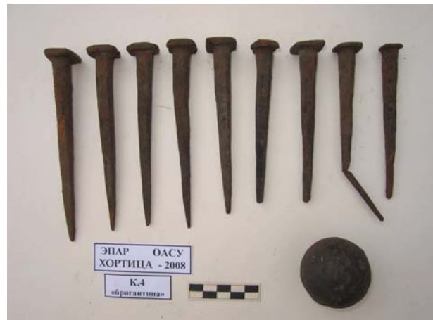
Фото 15. Гвозди от внешней обшивки бригантины и однофунтовое ядро.

Но основные работы Экспедиции протекали в районе балки Корнечиха, где, как отмечалось выше, была обнаружена оторвавшаяся от корпуса корма бригантины.