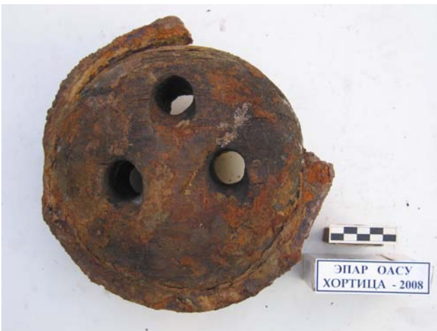
Фото 5. Корабельный юферс до реставрации. 1736-39 гг.

Ближе к берегу в 2006 году был обнаружен юферс с обломленным крюком (фото 5, фото 6 справа после консервации и реставрации). Еще один юферс передан руководителем конного театра Ю.Капишинским, где эта случайная находка хранилась несколько лет (фото 5 слева).