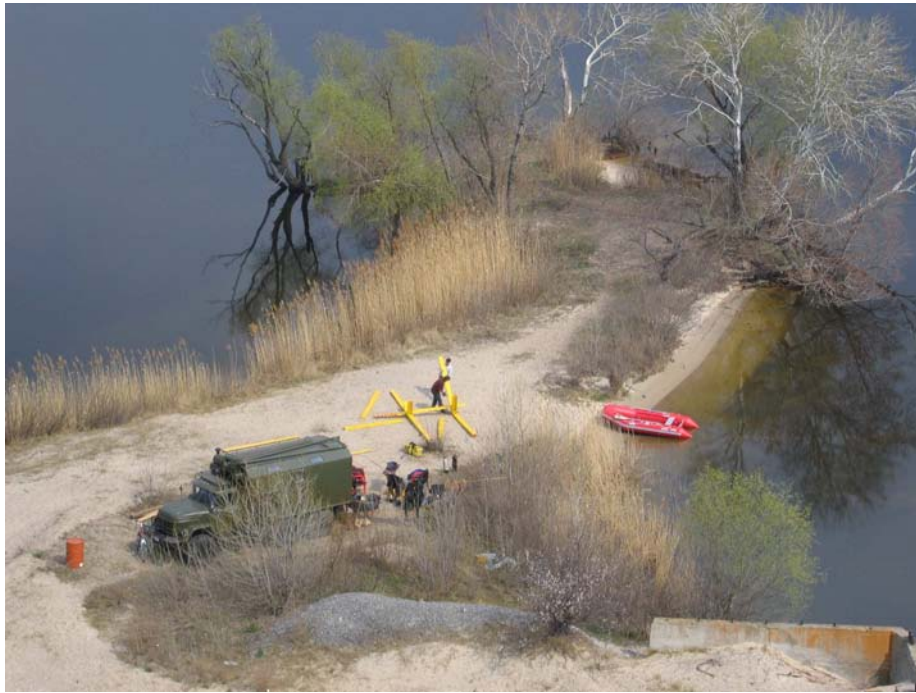
Фото 17. Сборка стапеля для подъема кормовой части бригантины на месте базирования экспедиции в 2007 году.

Подъем кормы бригантины осуществлен при помощи плавкрана и водолазного бота Пятого отряда гидротехнических работ (фото 18).