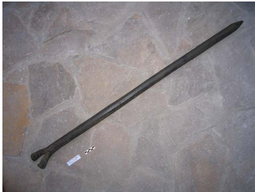
Фото 9. Лом кованый. 1736-39 гг.

Напротив мыса скалы Наумовой на глубине 15 метров найден железный кованый лом с одним расплюснутым и раздвоенным концом и другим заостренным (фото 9), который очень хорошо сохранился.