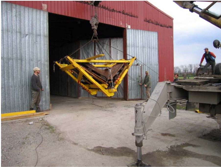
Фото 19. Выгрузка кормы бригантини возле реставрационного ангара.

В ангаре, где походит консервация основной части корпуса бригантини, начата консервация поднятой кормовой части бригантини.