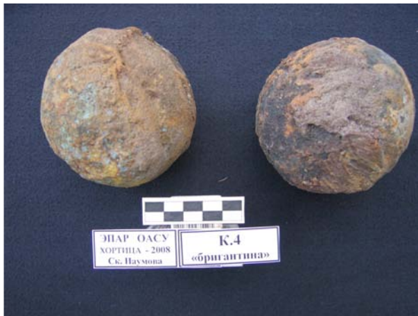
Фото 14. Трехфунтовые артиллерийские ядра.