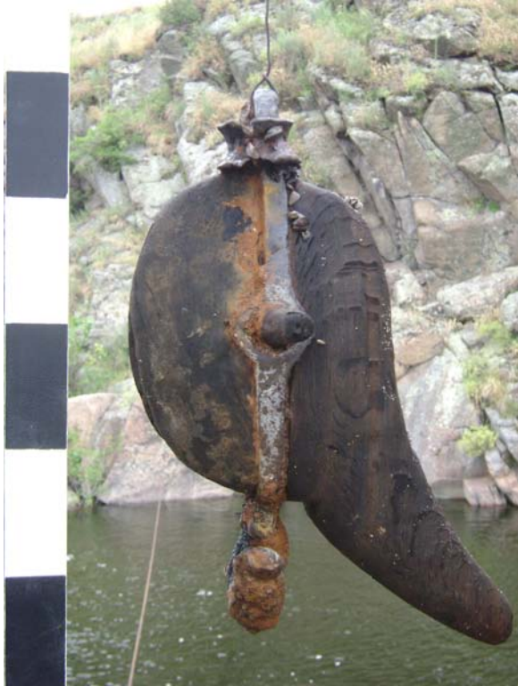
Фото 7. Корабельний блок с крюком после подъема. 1736-39гг.