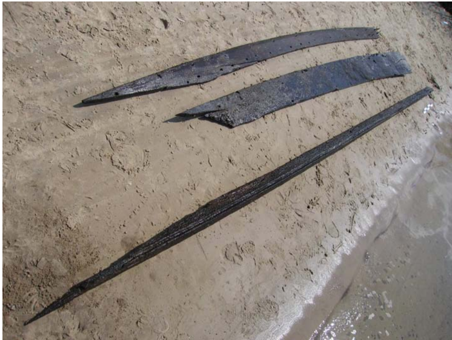
Фото 4. Дубовые обшивочные доски и кормовая часть кия от небольших судов 1736-39 гг.

Ближе к берегу в 2006 году был обнаружен юферс с обломленным крюком (фото 5, фото 6 справа после консервации и реставрации). Еще один юферс передан руководителем конного театра Ю.Капишинским, где эта случайная находка хранилась несколько лет (фото 5 слева).