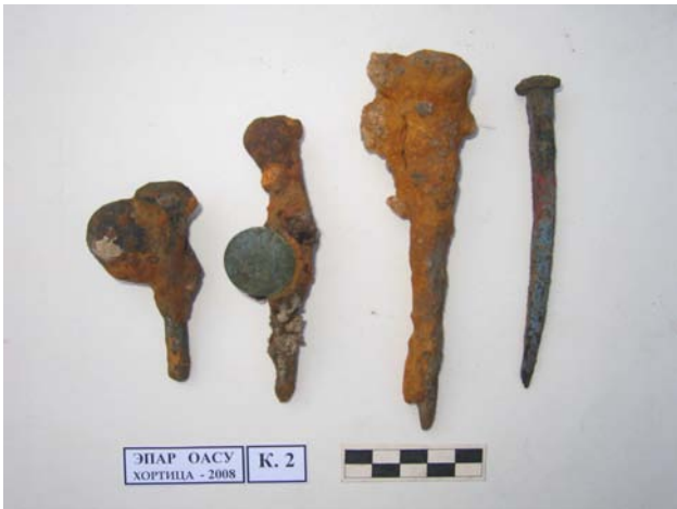
Фото 10. Корабельные гвозди с приросшей литой артиллерийской картечиной и приросшей пуговицей.

Возле точки привязки «С» найдены корабельные кованые гвозди. К одному гвоздю приросла пустотелая паяная латунная солдатская пуговица, к другому приросла литая чугунная артиллерийская картечина (фото 10).