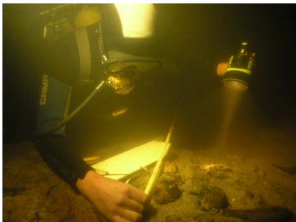
Фото 12. Подводная привязка обнаруженных ядер.

Непосредственно на месте раскопа поднятой бригантины обнаружены пушечные ядра, кованые гвозди и другие предметы (фото 12, 13).