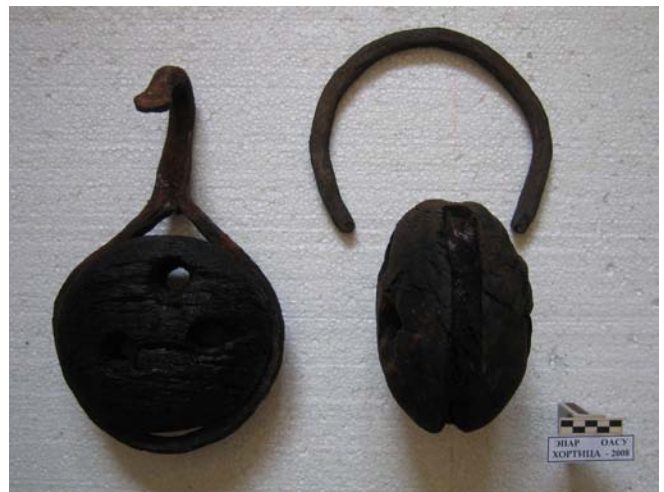
Фото 6. Корабельные юферсы. 1736-39 гг.

Очень необычный корабельный блок был обнаружен в зоне валунов на глубине 18 метров. Этот блок, изготовленный из дуба, имеет форму с выступающим «хвостом» (фото 7, фото 8 после реставрации).