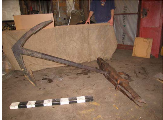
Фото 2. Двурогий якорь с деревянным штоком. 1736-39 гг.