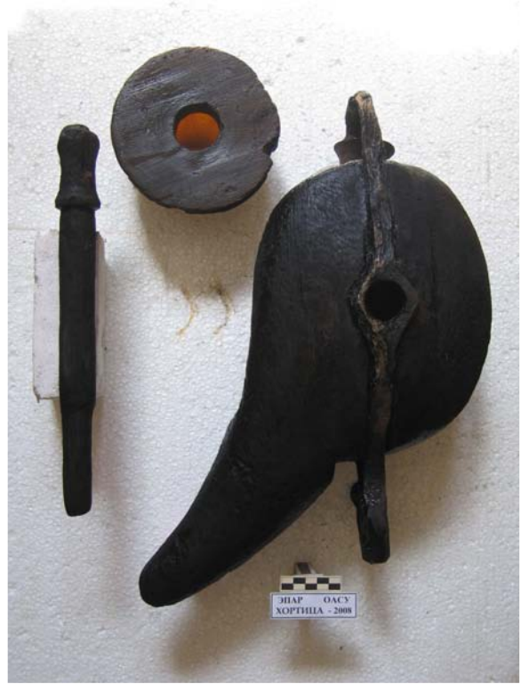
Фото 8. Корабельний блок с крюком после реставрации. 1736-39 гг.

Напротив мыса скалы Наумовой на глубине 15 метров найден железный кованый лом с одним расплюснутым и раздвоенным концом и другим заостренным (фото 9), который очень хорошо сохранился.