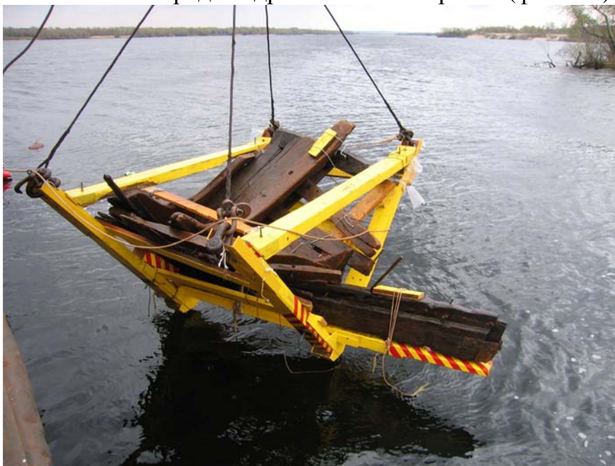
Фото 18. Подъем кормы, закрепленной в стапеле.

Подъем кормы бригантины осуществлен при помощи плавкрана и водолазного бота Пятого отряда гидротехнических работ (фото 18).