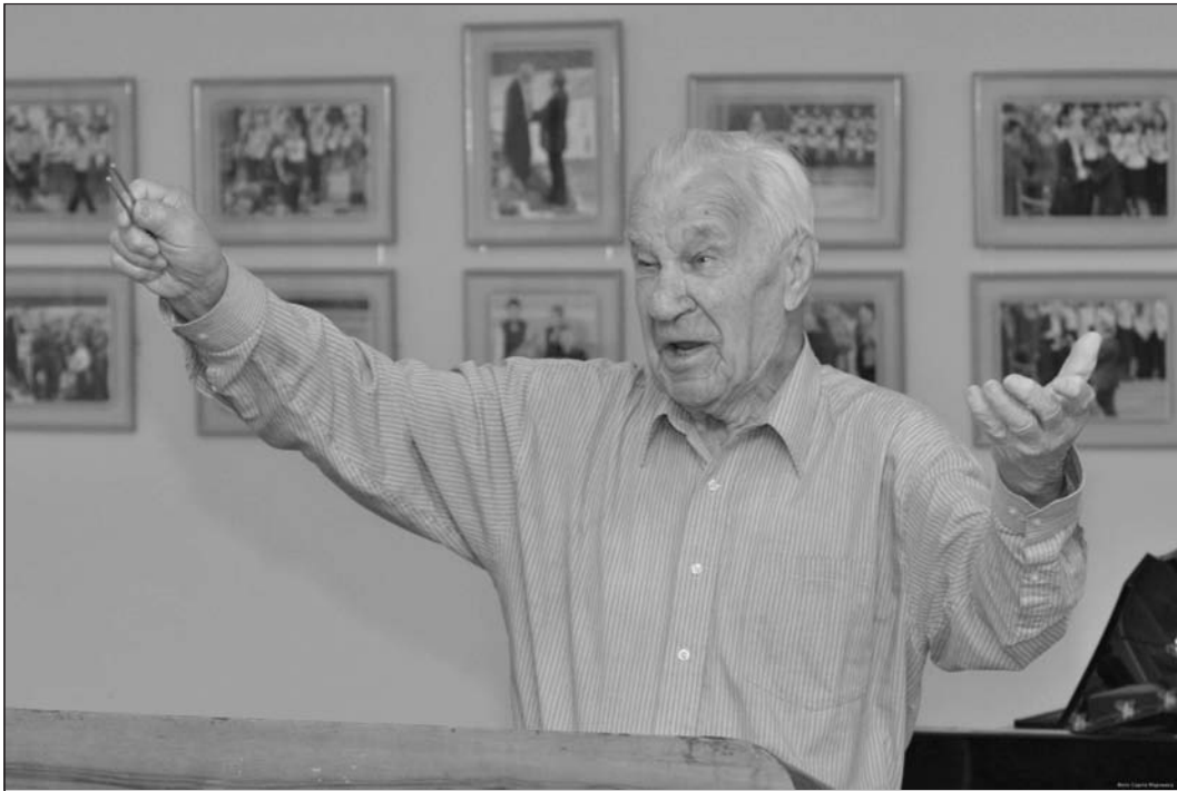
«Людський голос — найдосконаліший інструмент»