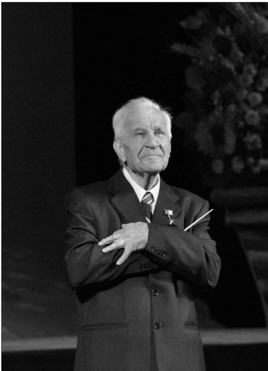
Найвища нагорода — вдячність людей