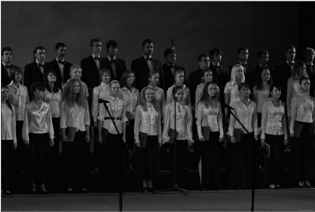
Студентський хор Національної музичної академії імені П.І.Чайковського

порівняти хіба що з навчальними вправами птаха-тата, який показує пташеняткам, як літати.