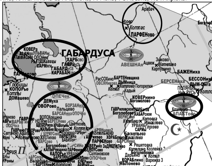
Рис. 16. Північний край ареалу зороастрійських назв у топонимії Росії

Чому коза – дереза? Документально засвідчена тотожність схожої на етнонім "дрига" основи назви р. ДРИХалуй (1774: ТРЕНАлуй) і ДЕРЕХлуй , ДЕРЕГ луй у с. Остриця Чв (Глибока) [СГУ, 183] < *Bothr-. Тоді можна формально пов'язати з цими назвами гідроніми ДЕРЕГова Хк, ДЕРЕЗівка Хк і п'ять назв балок ДЕРЕЗуВАТа < дриги з Ваті? (Один з потоків ґабрів імовірно ішов з колхидського порту Ваті, що й могло зумовити цілий пласт назв: у такий спосіб вони набувають осмисленості: р. Гав-