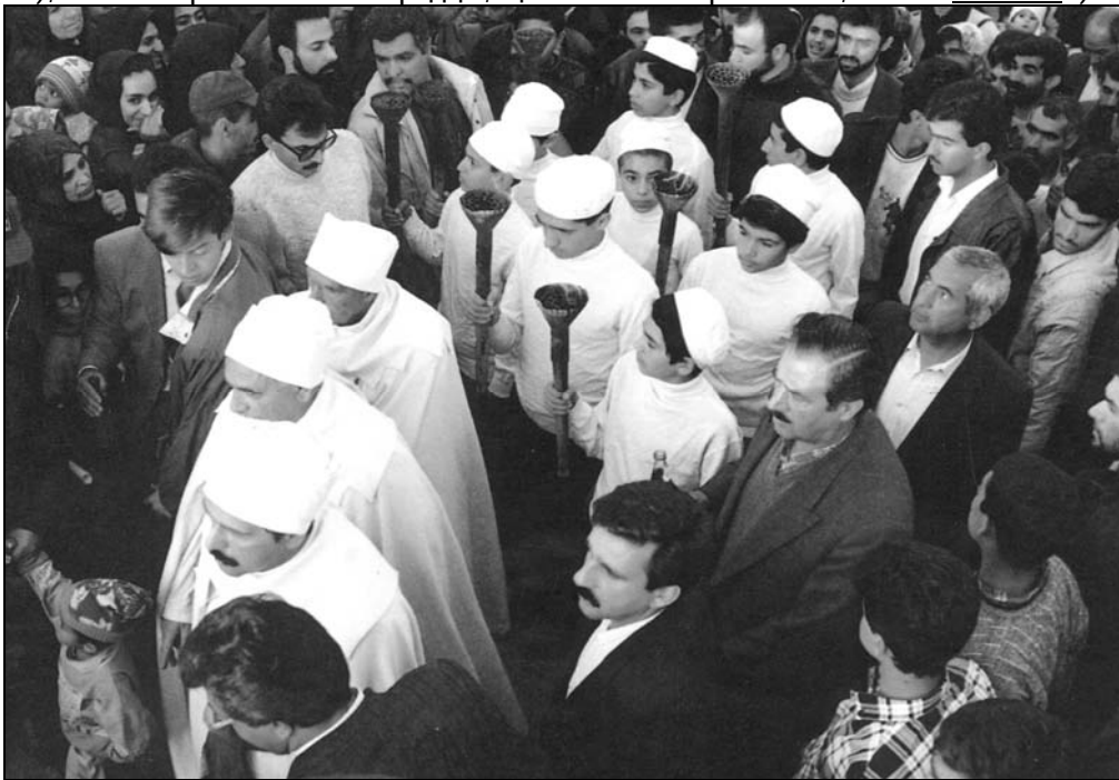
Рис. 18. Схожі на українські, характерні вусаті безбороді обличчя в іранському натовпі. Хід зі смолоскипами на зороастрійському святі Садех у Кермані (Іран) (пор. топоніми в Україні: Сади, Садове, Ґалаґанівка, Білівці, Біляни, Біличі, Більчаки, Білоголови)

ців з Киренаїки. (Промовистий факт зв'язку понять 'волхви' і 'богумили' на Русі: волхв (NB), який 989 р. очолив новгородців, що не бажали хреститися, звався Богомил! )