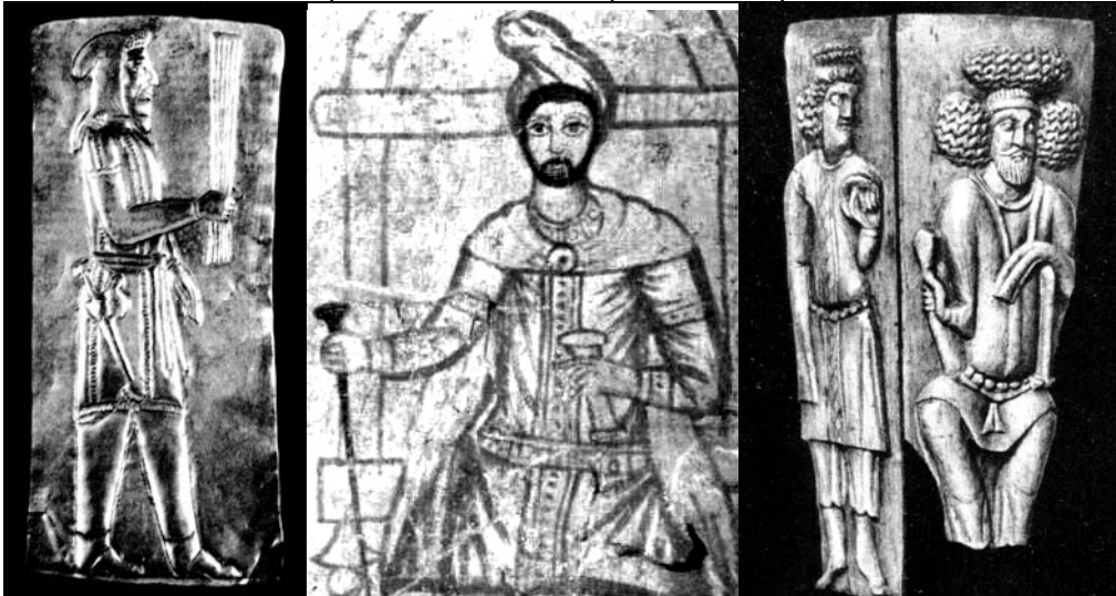
Рис. 12. Маг з барсамом у тїарї з навушниками- "каплями" (золота платївка з Амударїїнського скарбу, Британський музей). Заратустра (фреска з розкопок в м. Дурра-Европос, Ірак). На ритонї зі слонової кїстки з Ольвії зображенї парфяни (тодї вони жили й "навпроти Ольвії" – відразу за Чорним морем, де тепер турки...).

З'ясувалося, що таке ж поширення у топонімії мають більш і менш істотні деталі цього вчення (рис. 10) – однієї з найдавніших "релігій пророків", що виростає з іранської міфології [Бойс]. Тільки тоді, опинившись у силовому полі десятків (а потім і сотень) тематично пов'язаних з ними назв, топоніми Обеста , Опечень починають сприйматися як більш імовірний топонімічний слід давньої обізнаності з зороастризмом там, де ці назви збереглися, а отже й серед наших предків.