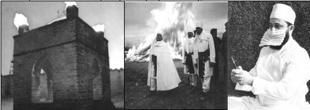
Рис. 13. Атешгах-е Барзін [Гафуров, 132] (божниця парсів) під Баку. Ритуальне багаття на святі Садех у Кермані. Сучасний маг з барсамом (пор. в Україні: СадІВЦІ, БілІВЦІ, БіЛЯНИ, БіЛІЧІ, БілоУСИ, ЗАМНИУСИ, Білоголови, Білобожниця, Білоцерківці, Біла Церква...)

'зелень'). Трава символізувала минуцність людського життя (пор. і у християнстві: "Усяка плоть – трава, і вся краса її – як цвіт польовий..." (Ісаїя 40,6; 1 Посл. Петра 1, 24) [Бойс, 12, прим. М. Бойс]). Сучасний барсам – це металева трубка, у наверх якої перед молитвою дастур вкладає пучечок трави (рис. 12:3). В Україні така назва збереглася у не раз перероблюваній топонімії Криму: ● Барасонівка = Барасанівка /тепер Барсове Км (Советський): ^НЕКРАСівка, Дмитрівка = ХЕЙРУС* < готс. heirus 'меч'; ВАРварівка. Також ● Бершадь Вн (рц): БИР.лі.вка < пир-, ПОТАШня < ав. аташ 'священний вогонь'; ЯЛАНЕЦЬ < пор. чес. jehlanec 'піраміда', ДЖУЛИНка (ці згадки можуть свідчити про те, що частина зороастрійців прибула з Єгипту).