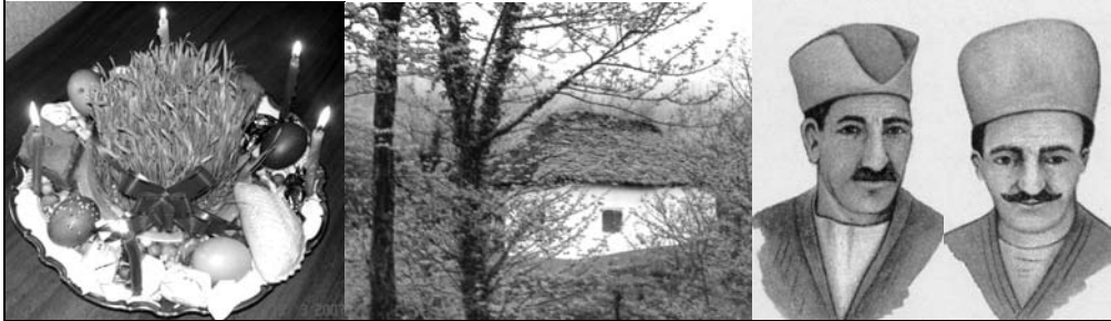
Рис. 20. Ірансько-українські культурні паралелі: центральний символ Ноурузу на святковому столі в Ірані ( гірка пророслого збіжжя в оточенні крашанок , вареників і свічок; фото 19.03.2007 р., Internet); типова сільська хата з області Мазендаран [Iran, 2]; перські сільські головні убори (пор. форму мазепінки і митри; малюнок з перського букваря)

Топооснова Капир- відома безвинятково в усьому виявленому ґабрському ареалі Європи. Так, в Росії – Капыревщина Смол., Капорье Калуз., Копорье Ленінг. (див. рис. 16), Копыряне Твер., у Білорусі – Капоранка Гом., у Чехії – Корореґ, у Бельгії – Каргіже, у Франції – Chevière (3), Chevier тощо, у Швеції – Корпарбо (єдина назва у Швеції, формально – Мідне село, але неподалік від уже знайомого нам м. Авеста!), у Косово – Корогісе (Корогіс), в Албанії – Карге (пор. тут же Gabricë), у Молдові – Капырь і Копаран , у Болгарії – Копаран , у Туреччині – Кораран, у Греції – Каррагіа, у Македонії – Сарагі, в Італії – о. Капрі. Чимало таких назв і на схід від Ірану: у Таджикистані – Капорель , у РФ Каптырево (Хакасія), у Пакистані – Капхарі , Капуре , в Індії – Хапарі , Хапрі , Купарі , Копарпада .