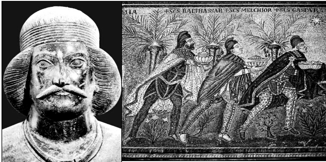
Рис. 9. Парфянський цар (I ст. до н.е., Шамі). Ще одне полтавське обличчя... Волхви – Балтазар, Мельхіор, Гаспар, три маги з Персії аршакидів – його молодші сучасники...

Кінця їм не було видно, і тоді спало на думку, що впорядкувати цю масу нових для дослідження фактів можна, послідовно врахувавши всі відомі етапи розвитку кожного з 4 звуків основи Парθ- . Вони включали, отже: 1) для першого приголосного – найдавніші форми з П, далі – з Б і В; 2) для голосної А не лише збереження іранського А, але і тодішній відомий і регулярний слов'янський відповідник його – О; 3) для приголосного Р – пізніший аланський варіант Л; 4) для давньперського θ – парфянський Х; 5) цей щілинний θ/Х міг розміщуватися перед Р/Л, або після нього. Організувавши у такий спосіб простір таблиці на рис. 6, тепер зручно було приступити до розподілу топонімів за будь-яким із 48 (!) етномовних варіантів топооснови Парθ- . Такий розподіл водночас давав загальне уявлення про тривалий історичний період вжитку цієї топооснови у місцевих назвах Наддніпрянщини (від 20 до 23 століть), причому, водночас у кількох різних етномовних середовищах (перси, парфянці, скіфи, сармати – плюс греки й слов'яни).