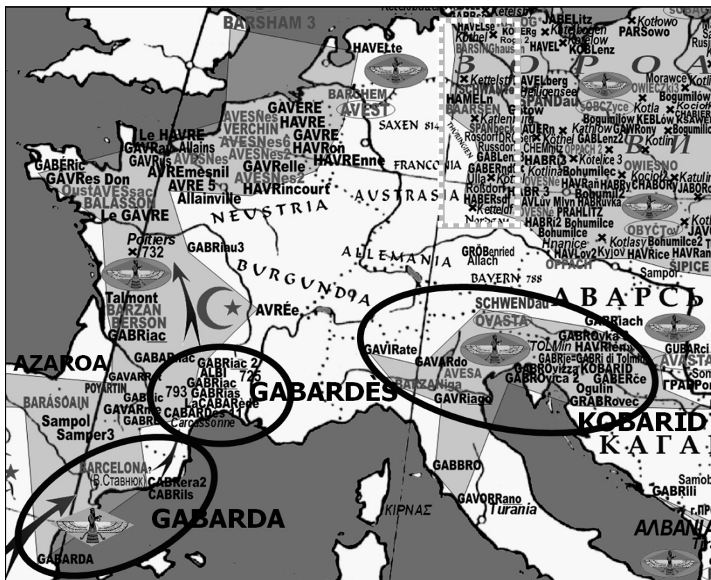
Рис. 19. Атлантичне пасмо ґабрських назв (див. рис. 14)