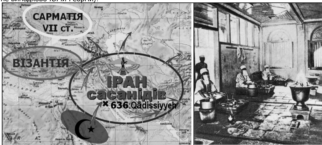
Рис. 14. Арабське завоювання Персії і втеча ґабрів. Парська божниця у Бомбеї

Бухара, зМАЖине < Мазда, ВЕСЕЛЕ, КИЇВське, СОСНівка, КИЯшківське, КРУГлик; • Пирятин Рв (Дубно): ^П.ОВЧа < Авеста?, МИЛЬча < Мілет; БІЛО городка, БІЛО бережжя, НаРАїв < Рай 'Рага, Тегеран', СА ди 2, КОСТянець < кусті, ОЗЕРяни, СТУДянка, СОСНівка, ЯСИНівка; • Пилятин Чг (Козелець): Гло.МАЗДИ < Мазда, БІЛ ейки, ДЕШки < дагма, БОРСуків < перс?, барсам?, ПАРХимів < Парфія, БІЛ ики, На БІЛ ьське, ОЗЕРне; • Пиротчине См (Кролевець): ^ГРЕЧкине; АЛТИНівка < тат. алтин 'золото', імовірний переклад складу зард- 'золото' з імені Зардошт 'Заратустра', тут же р. БІЛ ьця = БІЛ ька [СГУ, 57], АРТюхове < ір. арт 'божество', БІЛ Огріве, (у XVII ст. і с. БЪЛ ка), ГУБАР.івщина < ґабр-?, Червона ГІР ка < *Красна, ПЮГЮРлівка, ГРИБаньове, ВЕСЕЛі ГОРи, З.АГОРівка, З.АЗІРки < Азор - (Ахура), ЯРове, ЯРо.СЛАВ.ець < Ахура + слав- (звідси ж і язичницьке ім'я київського князя, хресне ім'я якого не випадково ЮРІЙ -Георгій).