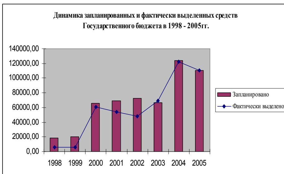
Рис. 5. Динамика запланированных и фактически выделенных средств Государственного бюджета в 1998-2005 гг.

Источник: составлено автором по материалам [1].