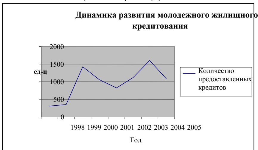
Рис. 2. Динамика развития молодежного жилищного кредитования (по количеству предоставленных кредитов).