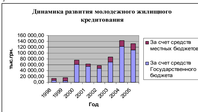
Рис. 1. Динамика развития молодежного жилищного кредитования (по источникам финансирования)