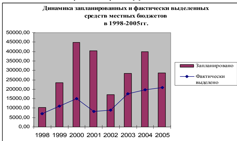
Рис. 4. Динамика запланированных и фактически выделенных средств местных бюджетов в 1998-2005 гг.

Источник: составлено автором по материалам [1].