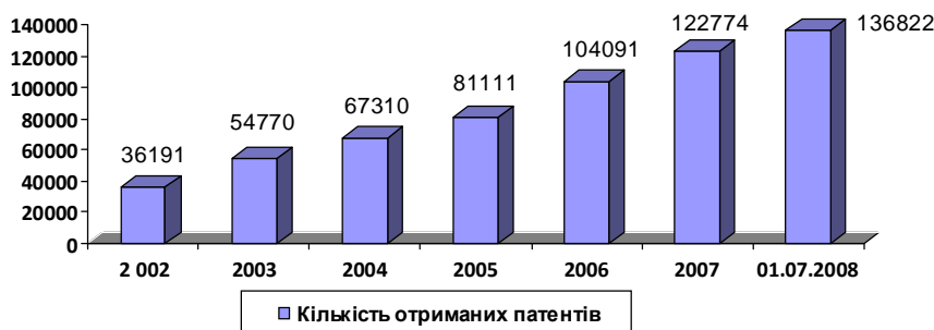
Рис. 1. Кількість отриманих патентів на гральні автомати за період 2002-2008 рр.

У результаті прийняття Закону України "Про заборону грального бізнесу в Україні" у 2009 р. було викрито 3,9 тис. фактів протиправної діяльності, серед них 1,8 тис. - надання послуг без відповідної ліцензії та 2,2 тис. - без патенту. Виявлено 13,5 тис. одиниць грального обладнання (гральні автомати та