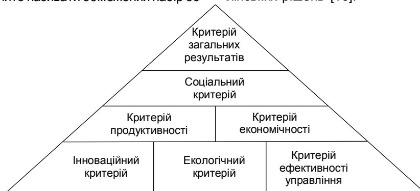
Рис. 1. "Піраміда" взаємозв'язків критеріїв ефективності стимулювання соціально-економічного розвитку регіону.

новних параметрів, які використовуються для відстежування й діагностики результатів діяльності компанії та подальшого ухвалення на їх основі управлінських рішень [10].