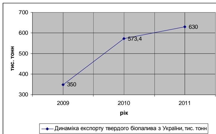
Рис. 2. Динаміка експорту твердого біопалива з України.

Щодо України, то, за дослідженням компанії Fuel Alternative , динаміка експорту біопалива з України має тенденцію до збільшення (рис. 2), при цьому 88 % усього біопалива, виробленого в Україні, іде на експорт і лише 12 % використовується для внутрішніх потреб.